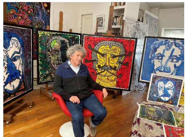
Robert Combas dans son atelier

En 1992, Robert Combas donnait le ton qu'il voulait donner à cet hommage. « Moi, j'ai voulu faire comme ses mots de jeux, être irrespectueux un peu pour le faire vivre beaucoup et non pas le hisser sur un pied d'Estale d'où il se casserait la gueule et on s'apercevrait que ce n'était que du plâtre et que les pieds destaleurs étaient des tricheurs, comme ces bustes classiques qu'on trouve dans les magasins de souvenirs. La plupart des dessins ou sculptures de Brassens que j'ai vus étaient figés comme si on voulait le statufier, le ligoter sans vie. Je préférerais faire 100 portraits de lui en couleur avec les moustaches vertes ou orange s'il le faut, pour le rendre humain, pour lui redonner son rythme tranquille, inimitable. J'espère que je serai compris dans mon essai de compréhension de l'œuvre d'un champion de la chanson et d'un immense pourfendeur des cons. » Robert Combas