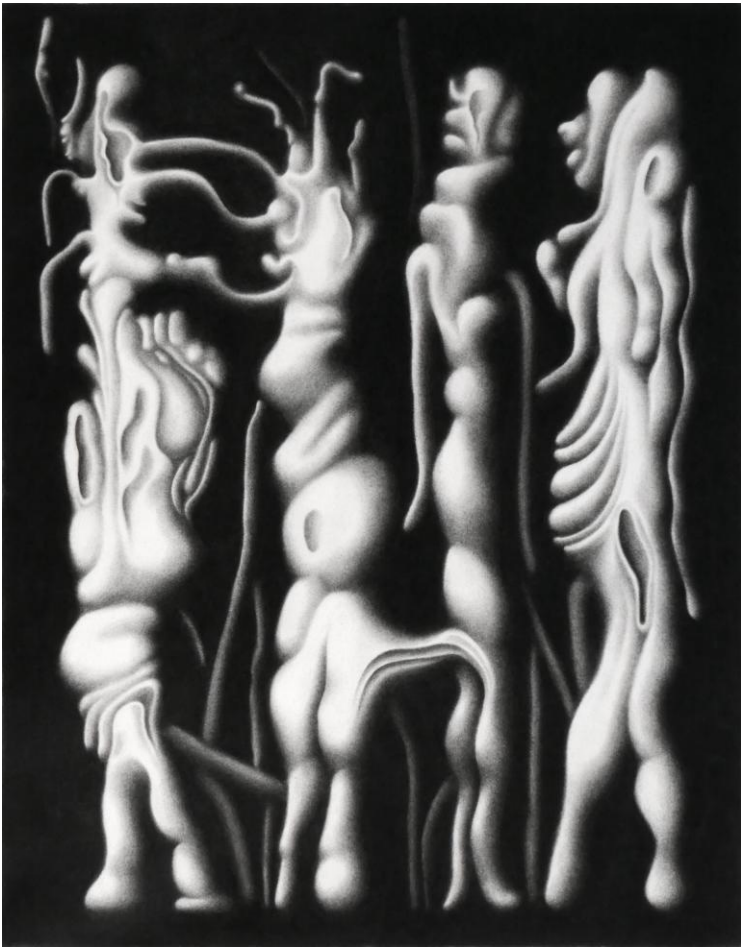
Chloé Poizat, Dans la nuit (VII) (série), 2018 fusain sur papier, L50 x H65 cm.