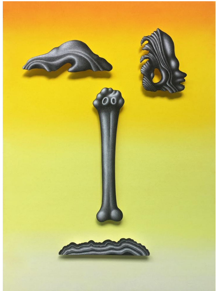
Chloé Poizat, Lambeaux (série), 2019 fusain et pastel sec sur papier, L43,8 x H59,8 cm.