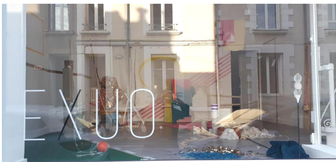
Vitrine de l'espace Exuo