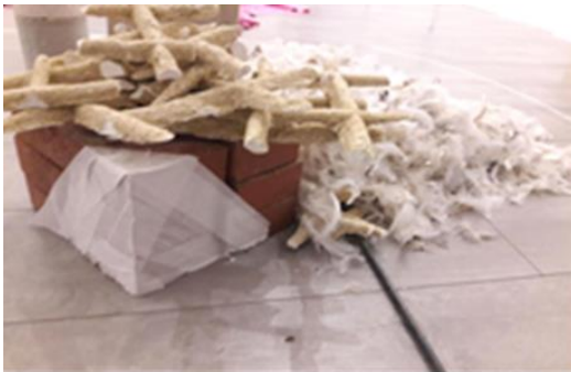
Vue de la deuxième salle