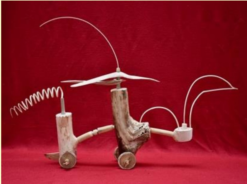
L'ornithogire , 2012, sculpture bois