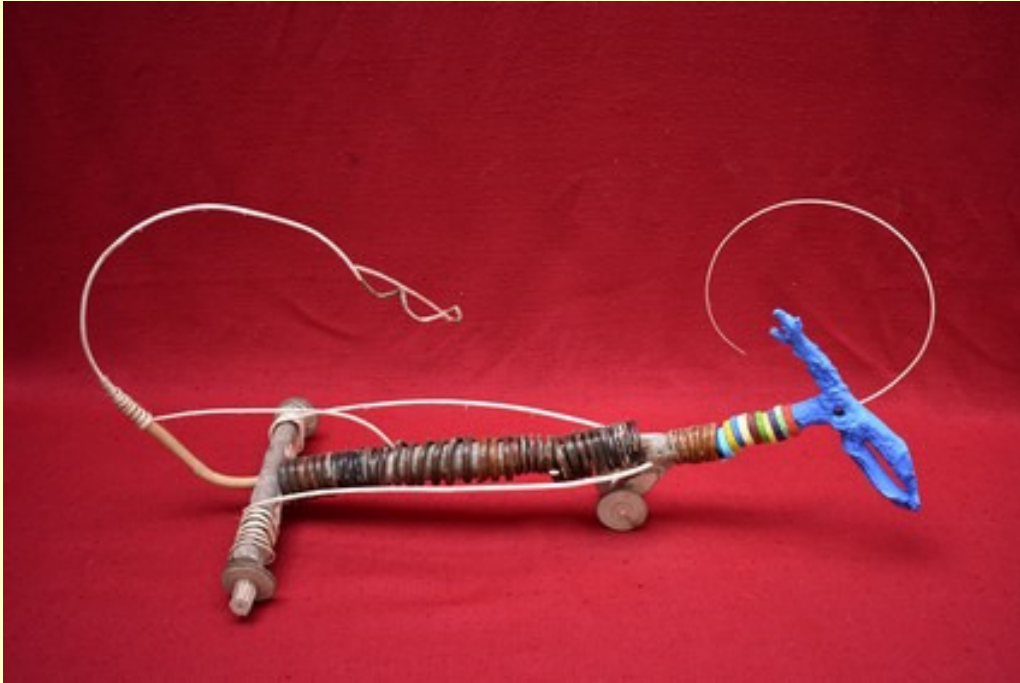
Le lièvre bleu , 2019, sculpture bois

Lorsqu'on les contemple et lorsqu'on s'en occupe, les plantes nous apportent beaucoup de bien-être.