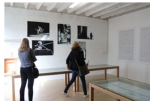
Exposition Bernard Heidsieck