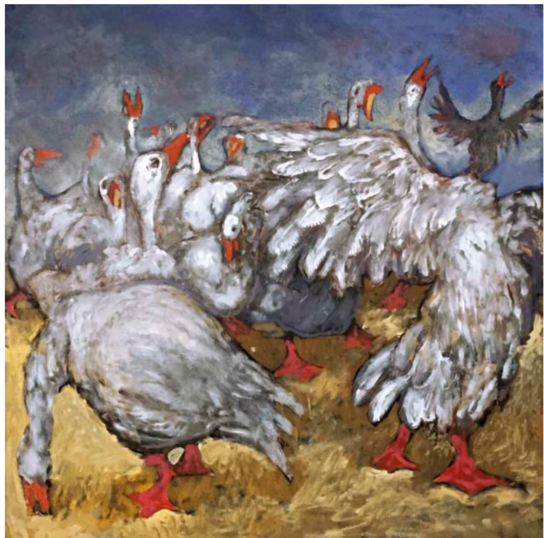
Cyr Boitard, Volatiles #1, huile sur toile

Pour l'exposition, Cyr Boitard propose des toiles nouvelles, traitant sur un même plan énigmatique, mystérieux, parfois drôle, les oies, sujet récurrent, et les humains.