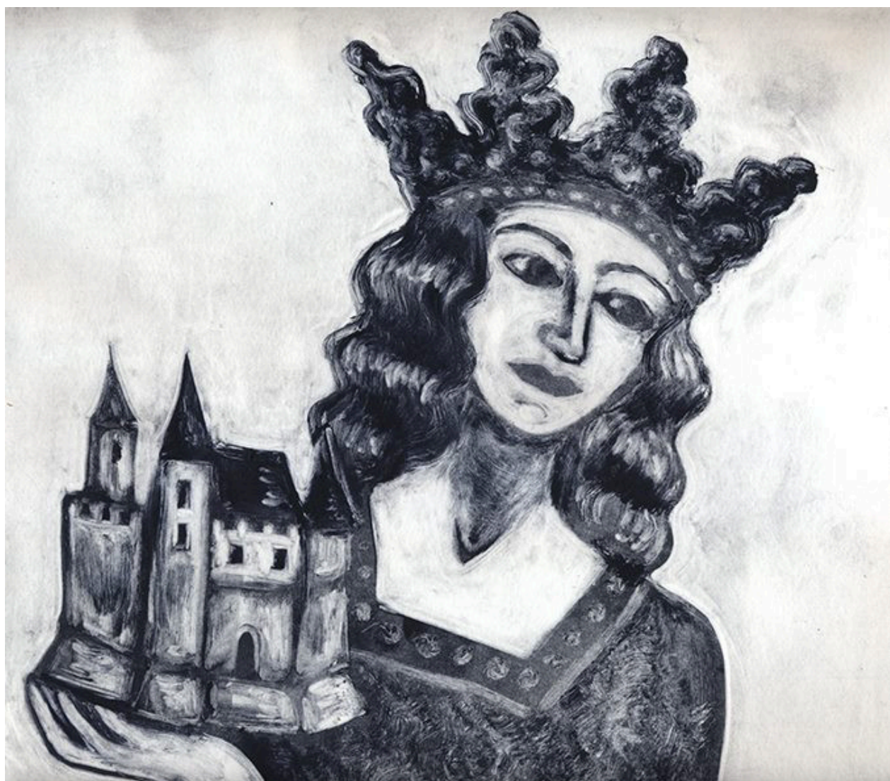
Hernance des Robert, coup de Château, monotype, 30x30 cm

Vernissage le jeudi 2 mai de 17h à 21h en présence des artistes