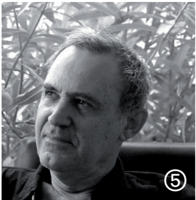
Portrait © DR

Tours (37 000), Place Choiseul Gratuit / Infos : eternalnetwork.fr