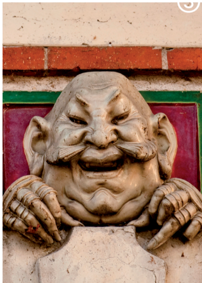
Terre cuite

Départ : Place Courtemanche (devant l'Office de Tourisme) Inscription obligatoire - places limitées : Pays Loire Touraine - 02 47 57 30 83