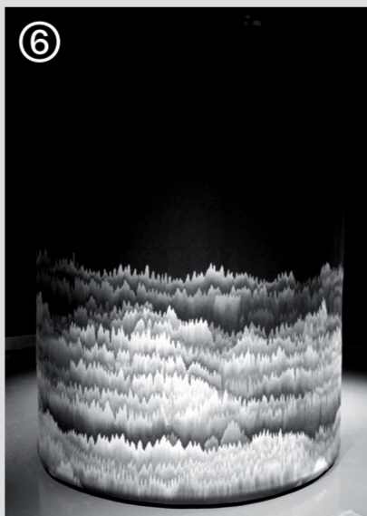
Panoramique polyphonique, 2013 Cécile Le Talec