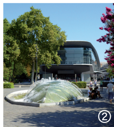
La Maison de Croissance, Meligren & Johansen

Vernissage le 18 oct. à 18.30 Château royal de Blois, Aile Gaston d'Orléans, Place du château, 41 000 Blois Tarif : droit d'entrée au monument Infos : 02 54 90 33 33