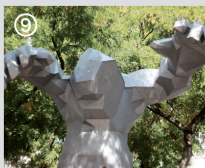
Le Monstre, Xavier Veilhan © ADAGP Paris / Al. Callebotte

La Laverie, 9 rue du Port, 37520 La Riche Entrée libre. Du lundi au vendredi, 10.00 - 19.00 / Week-end, 15.00 - 18.00. Infos : blog.lalaverie.net