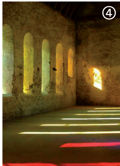
Lévoz, Sarkis