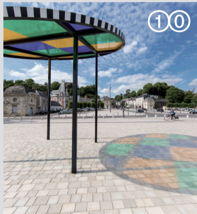
Attrape soleil, Daniel Buren

Tours (37 000) Départ : Place de la Tranchée, côté est. Fin de parcours gare de Tours Inscription gratuite : service patrimoine, Ville de Tours - 02 47 21 61 88 animation-patrimoine@ ville-tours.fr