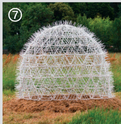
La Maison de Croissance, Melgren & Johansen