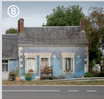
ARN Charentilly, Éric Tabuchi © Éric Tabuchi

Baulieu-lès-Loches (37 600) Accès libre au parcours / Infos : www. expo-beauxlieux.fr