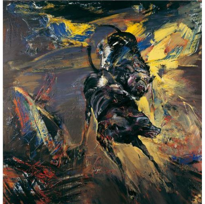
Rage, 1995 200 x 200 cm huile sur toile