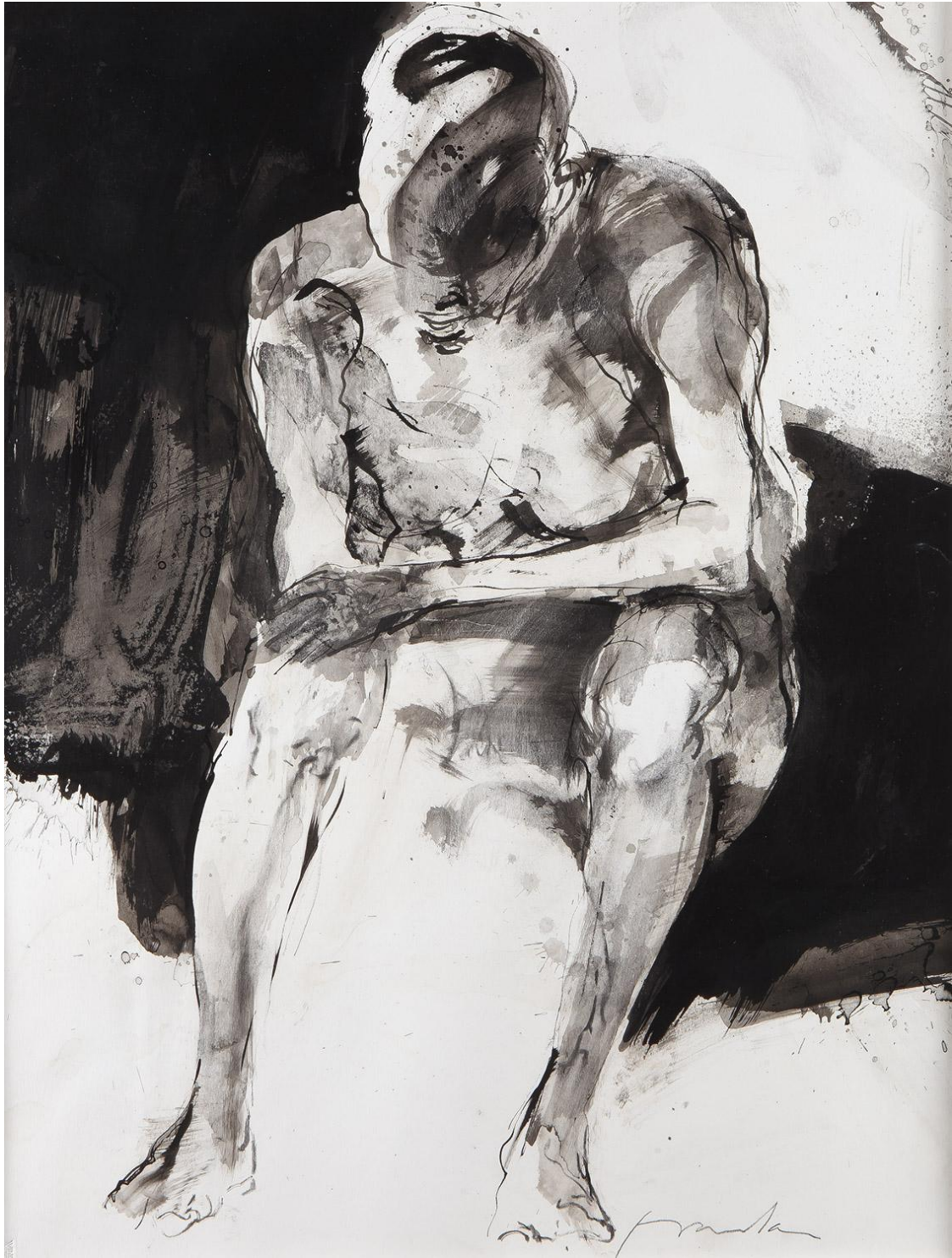
Penseur 65 x 50 cm encre de Chine