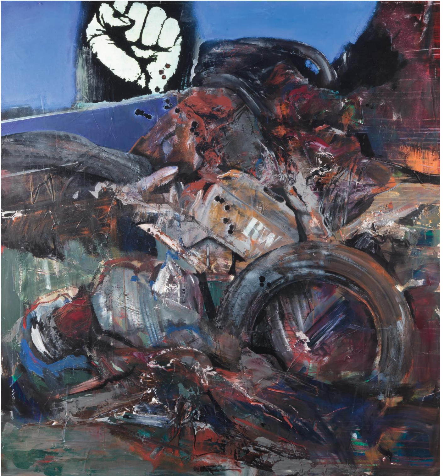
Barricades 200 x 200 cm peinture sur toile © Denis Durand @ Galerie Capazza