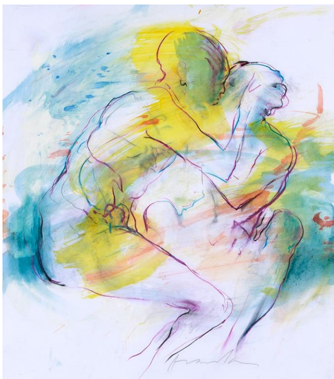
Couple 45 x 40 cm encre et pastel sur papier © Denis Durand @ Galerie Capazza