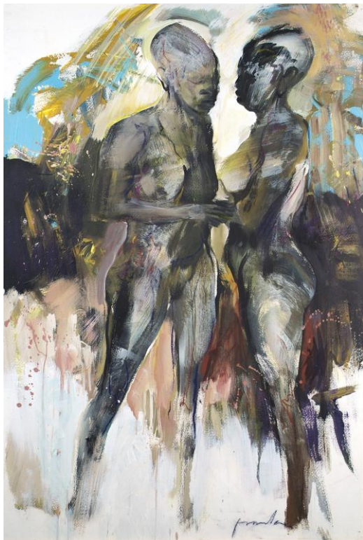
Échange 110 x 75 cm papier marouflé sur toile © Denis Durand @ Galerie Capazza