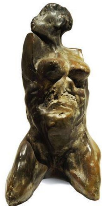
Émoi, 2012 hauteur 80 cm bronze © Denis Durand @ Galerie Capazza