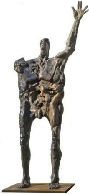
Huitième jour, 1993 hauteur 215 cm bronze © Denis Durand @ Galerie Capazza