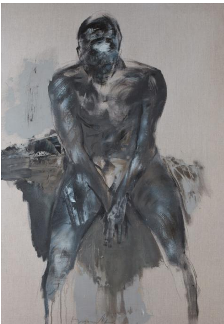
Méditation 116 x 81 cm huile sur toile © Denis Durand @ Galerie Capazza