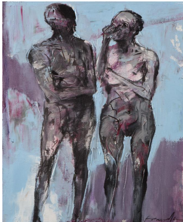
Couple sur fond bleu, 2015 46 x 38 cm huile sur toile © Denis Durand @ Galerie Capazza