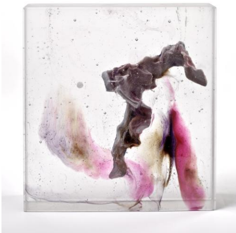
Chair et os VII, 2015 31 x 31 x 8 cm pâte de verre © Antoine Leperlier

Musée Ariana, Genève Musée de design et d'arts appliqués contemporains, Lausanne