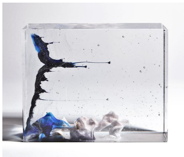
Chair et os XXIII, 2016 31 x 23 x 7 cm pâte de verre © Denis Durand @ Galerie Capazza