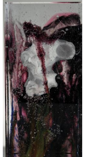
Espace d'un instant XXXII, 2018 23 x 12 x 9 cm pâte de verre © Antoine Leperlier