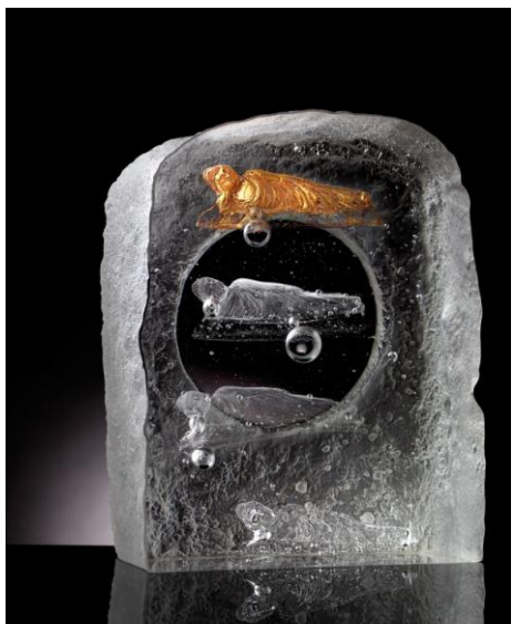
Past present future, enlightened 28 x 11,6 x 26 cm pâte de verre

Il considère le Liuli comme un messenger sur l'amour et la mort, la réalité et l'illusion, la lumière et l'ombre. Le style de Chang Yi est sans complexes, libre, plein d'entrain ; il accorde son travail avec des possibilités illimitées et s'appuie sur le Bouddhisme, la littérature et le Zen comme ses guides créatifs.