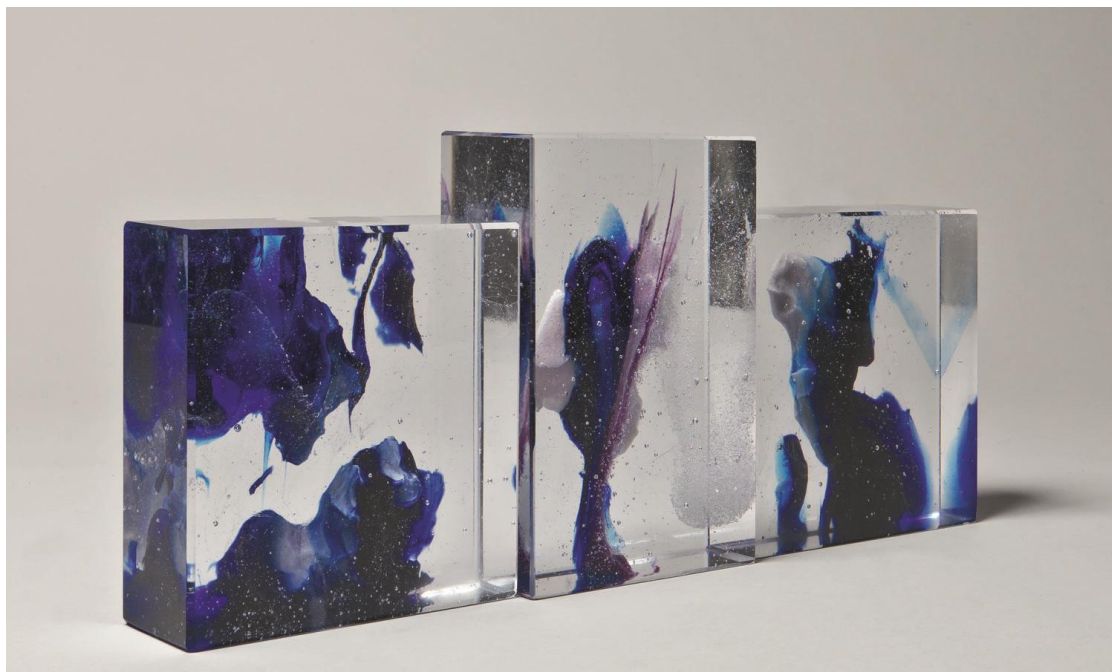
Espace d'un instant XXIV – triptyque, 2017 24 ,5 x 57,5 x 8,5 cm pâte de verre © Denis Durand @ Galerie Capazza