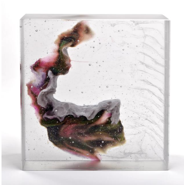
Chair et Os VIII, 2015 31,5 x 29,5 x 9,5 cm verre moulé et estampage de pâte de verre © Denis Durand @ Galerie Capazza