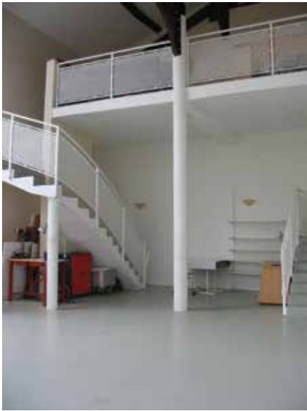
Vue de l'atelier