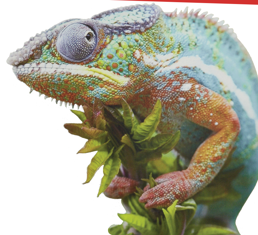
Katja Novitskova, Approximation V, 2013

LE RÊVE DES FORMES : ARTS, SCIENCES & CIE.