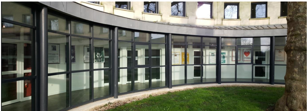
Galerie d'exposition vue depuis l'extérieur du bâtiment