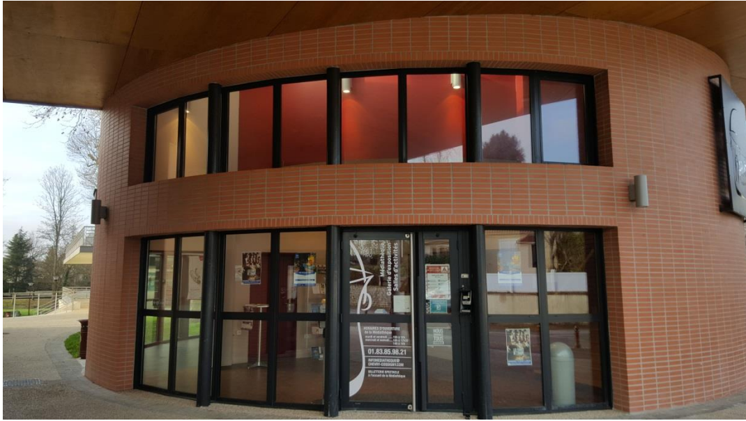
Entrée de la médiathèque (hall d'entrée vu de l'extérieur)