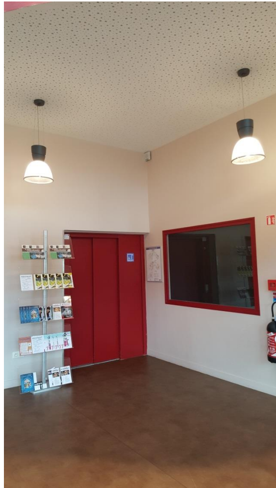
Partie basse du hall d'accueil