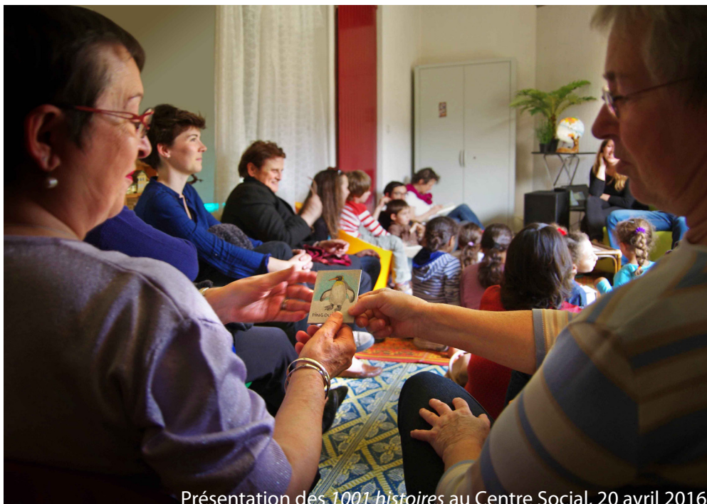
Présentation des 1001 histoires au Centre Social, 20 avril 2016.

Par ailleurs, certains partenaires du quartier organisent régulièrement des activités et événements culturels et socioculturels.