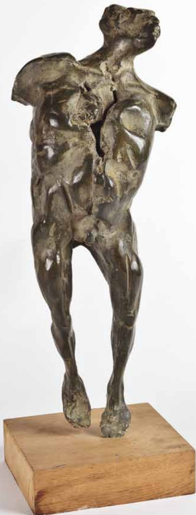
PROMÉTHÉE, Bronze H 52,5 cm