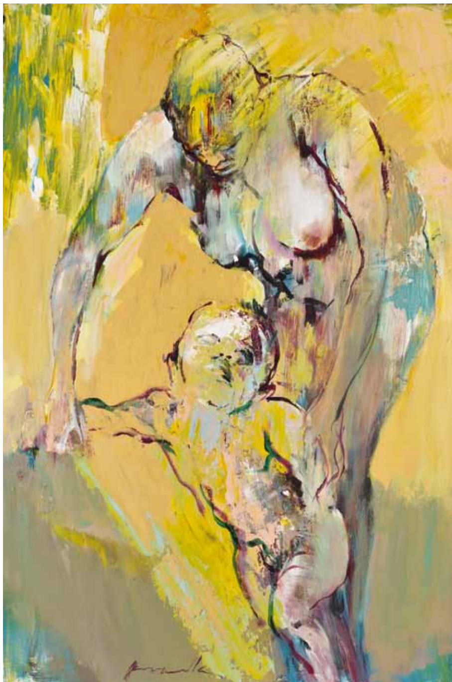
MATERNITÉ Acrylique sur toile 110 / 75 cm