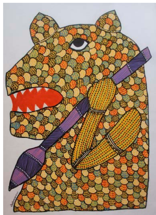
Ramesh Tekam, acrylique sur papier, 38x28 cm

Mais après quelques 1 400 ans d'hégémonie, le peuple Gond s'appauvrit et il n'y eut plus assez de familles riches pour soutenir les Pardhans.