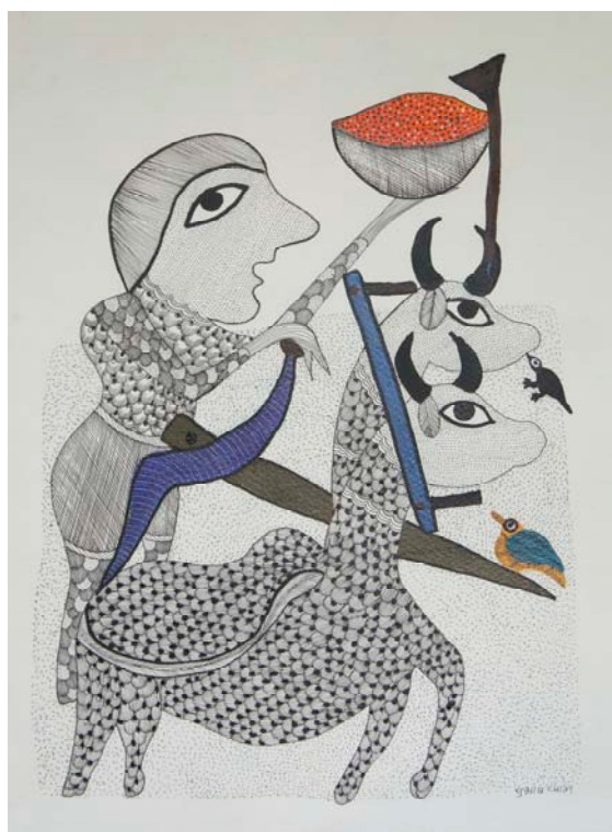
Subhash Vyam, le conte des 7 frères acrylique et encre sur papier, 38x28 cm, 15 peintures

Pourquoi Vernacular India ? Les artistes exposés sont contemporains mais s'inspirent à des degrés divers de cultes anciens, voir immémoriaux, transmis dans le cas des Gonds oralement et sans tradition picturale.