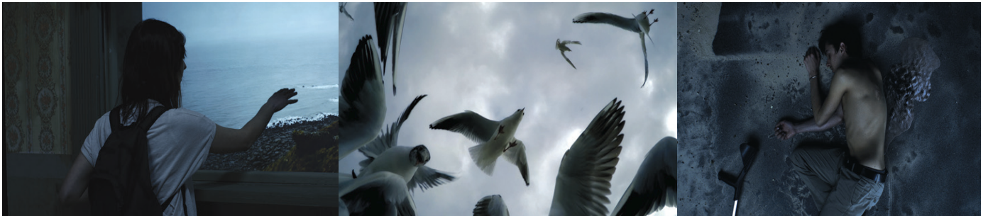
Excroissance, film 2015