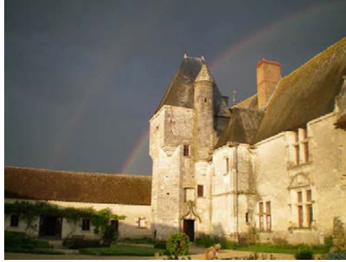
Lieu : Château de Chémery 41700 Chémery

par l'association FLUIDE Art Contemporain