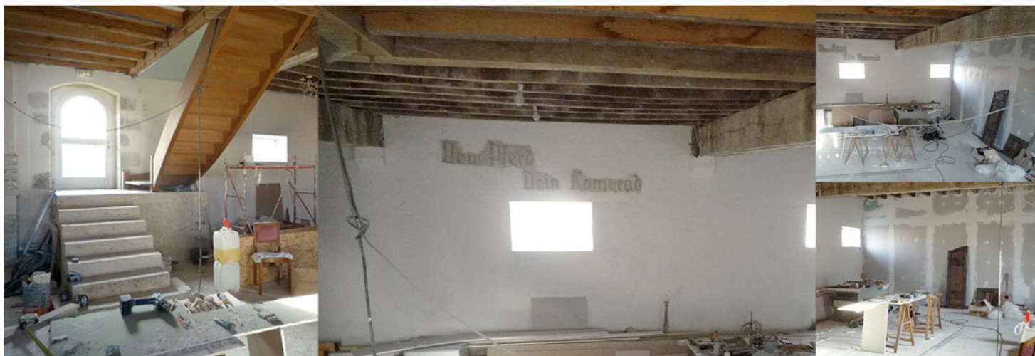
L'intérieur de la galerie (en cours de réalisation)

L'association FLUIDE ART CONTEMPORAIN est basée au Château de Chémery, dans la région centre. Cette région est réputée pour la Vallée de la Loire, classée patrimoine mondial de l'Unesco. Le château, construit à partir du Moyen-Age, a été remanié à la Renaissance puis a été transformé en ferme commune au XIXe siècle. La galerie Fluide est installée dans les anciennes étables datant du XIXe. Pendant la 2e guerre mondiale, les allemands ont occupé le chateau : des traces de cet événement sont visibles par des inscriptions en allemand sur les murs du château. Ainsi le château a été transformé par des époques successives et est un témoin de l'histoire locale et mondiale. Le bâtiment a subi les dommages du temps au cours des siècles, mais M. Axel Fontaine, architecte et actuel propriétaire, a restauré le château de façon authentique. Il a commencé à accueillir des voyageurs pour faire partager l'histoire de ce château : ainsi une partie du chateau est destinée aux chambre d'hôtes.