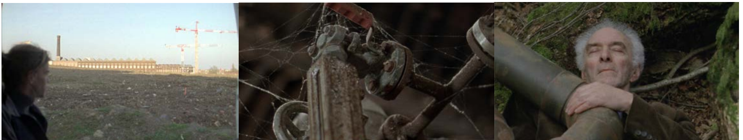
Un métier virgule deux, film 2014