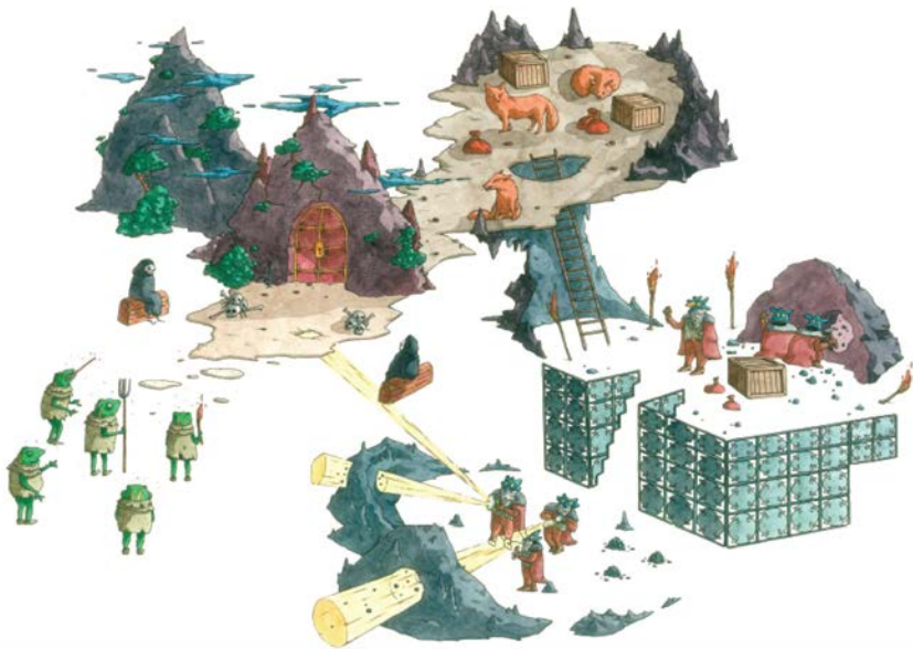
Les prospecteurs vénitiens I, 50 x 40cm, aquarelle, stylo noir, juillet 2014.