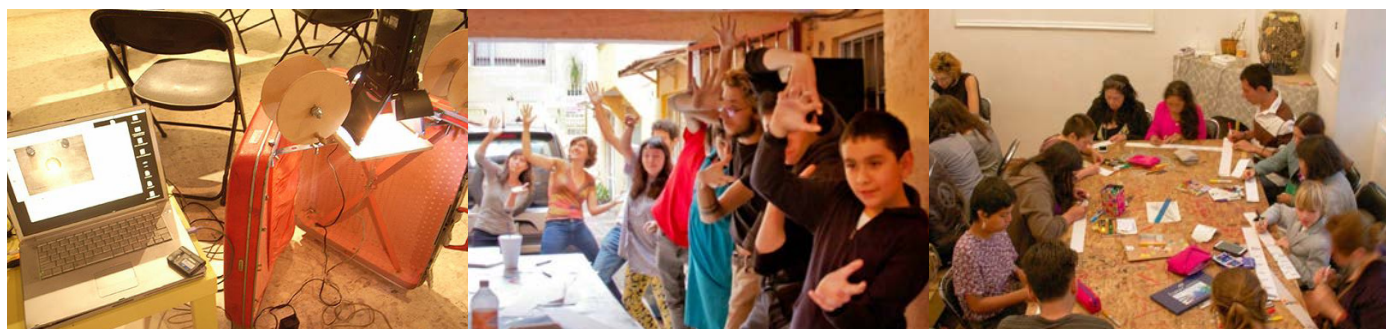
Exemple de workshop avec Chikara

Vous pouvez vous inscrire dès maintenant, c'est gratuit (max 25 personnes).