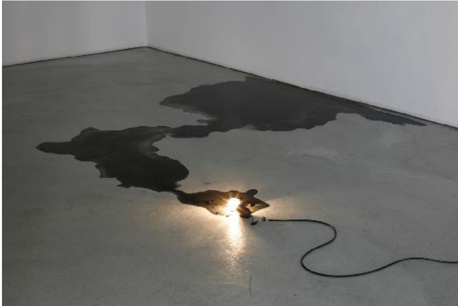
Sans titre, 2008, encre, glace et ampoule, dimension variable.