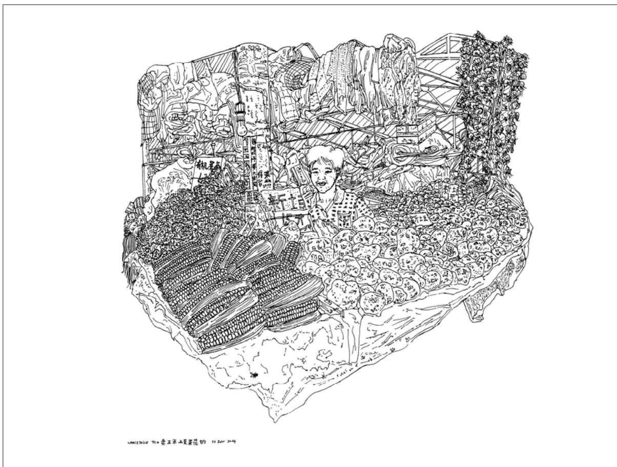
Christelle Téa, marché Xiyuan, maïs et patate, 2014, encre de Chine sur papier, 65 x 50 cm