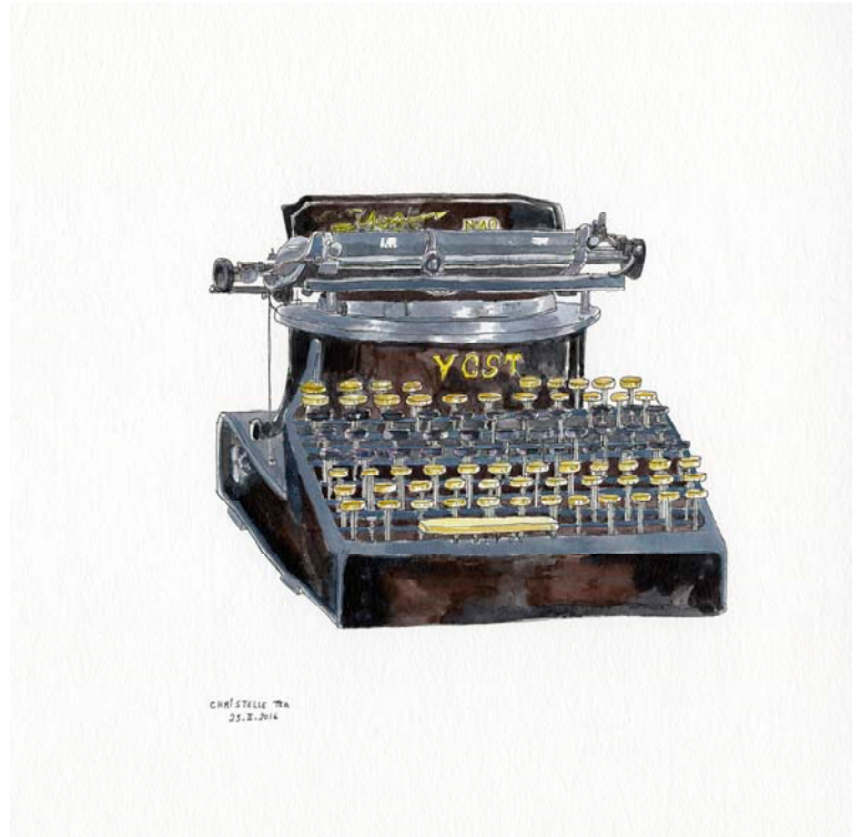
Christelle Téra, Machine à écrire Yost , Musée des Arts et Métiers, 2016, encre de Chine et aquarelle sur papier, 25,2 x 25,2 cm

La question du titre de l'exposition est venue naturellement en voyant les compositions de chaque portrait : centré sur une large feuille blanche format raisin, un visage apparaît, puis un corps, en pose de manière très classique, retrouvant ici les portraits de commande, avec, - cernant l'homme ou la femme observé - ce qui les caractérise ou ce qu'il/elle a envie de montrer dans un foisonnement vertigineux.