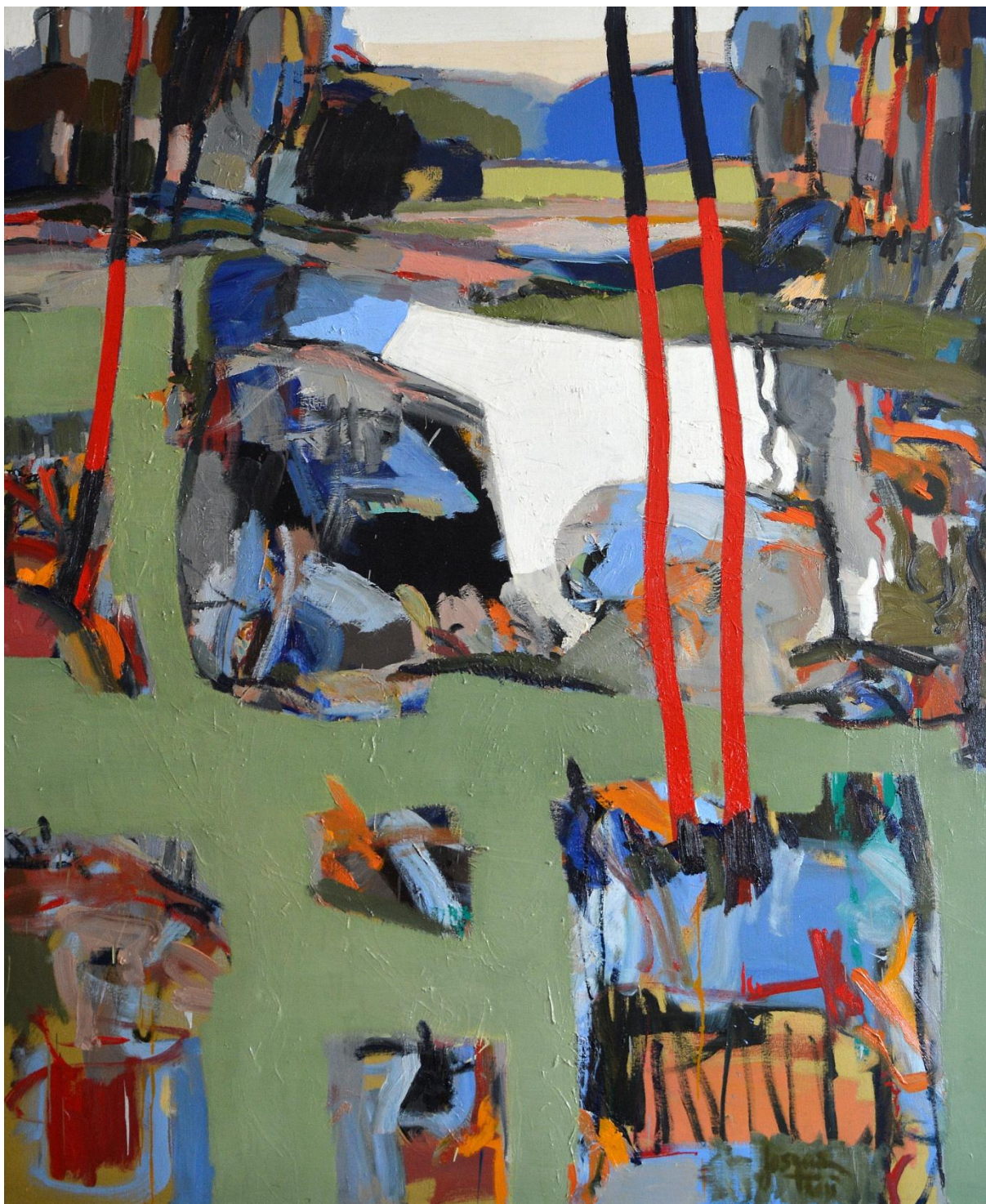
Les sources de la Creuse à Mille Vaches, 170X140 cm, 2011.