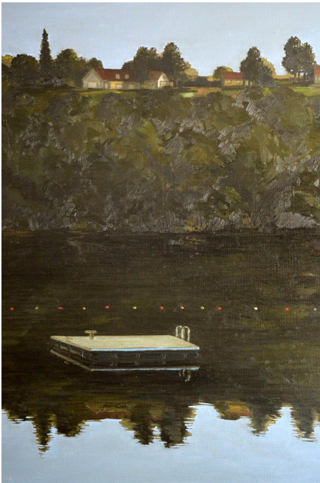
« Petit discours sur la vie et la mort ». Le ponton, (détail)