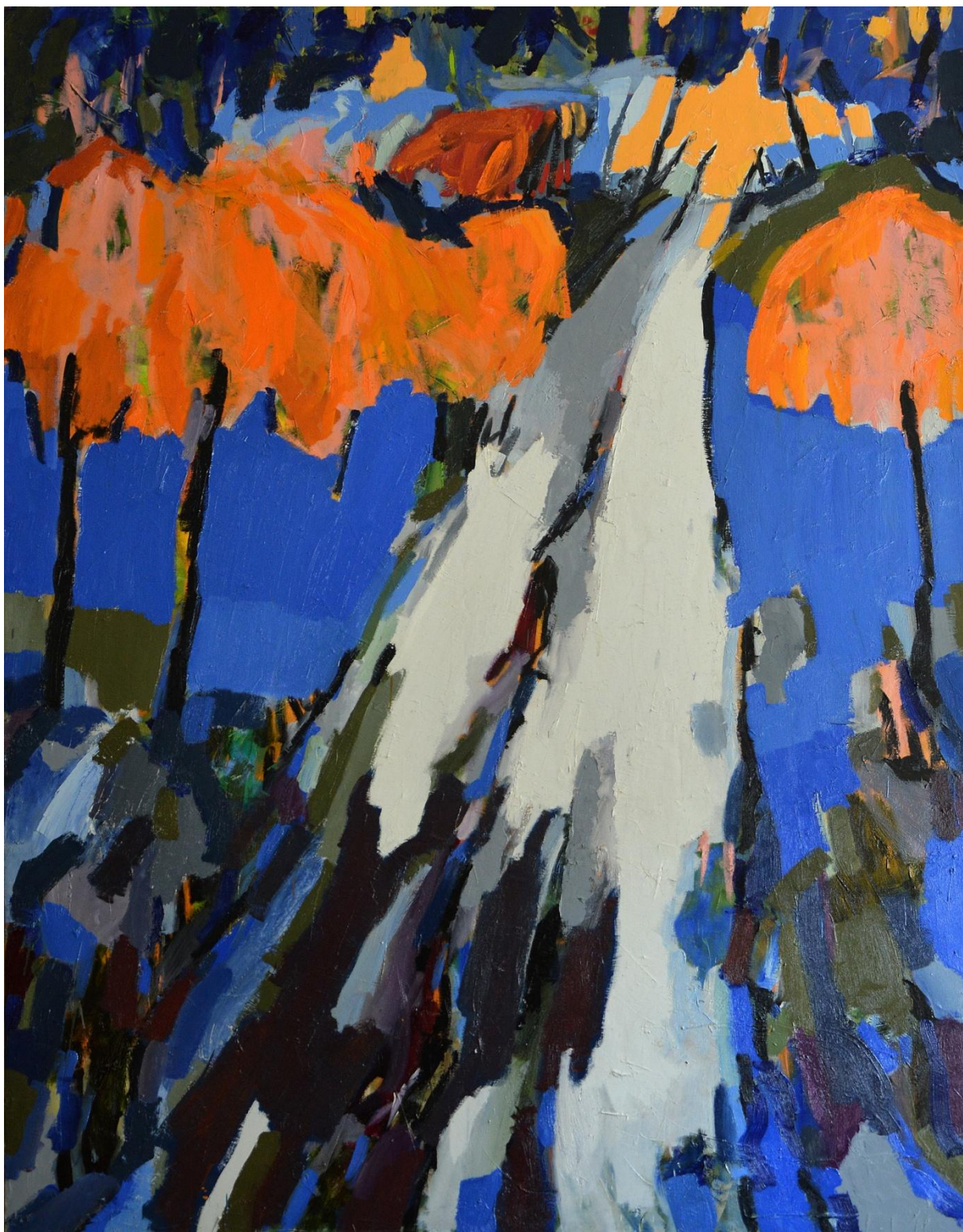
Le chemin de la vigne à Baudat, 200X150 cm