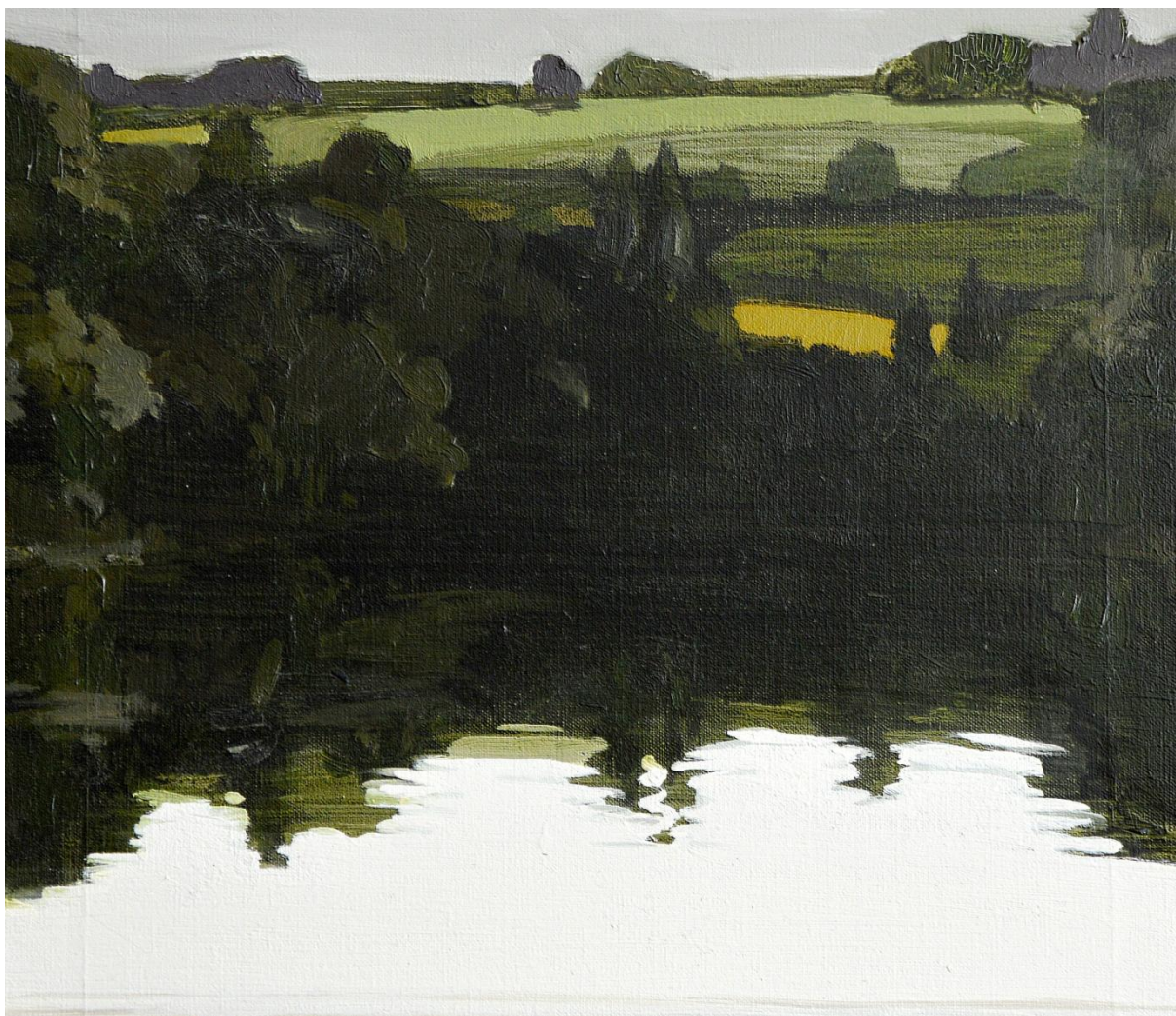
La côte de Fressignes vue de la plage de Bonnu, 50X50 cm.