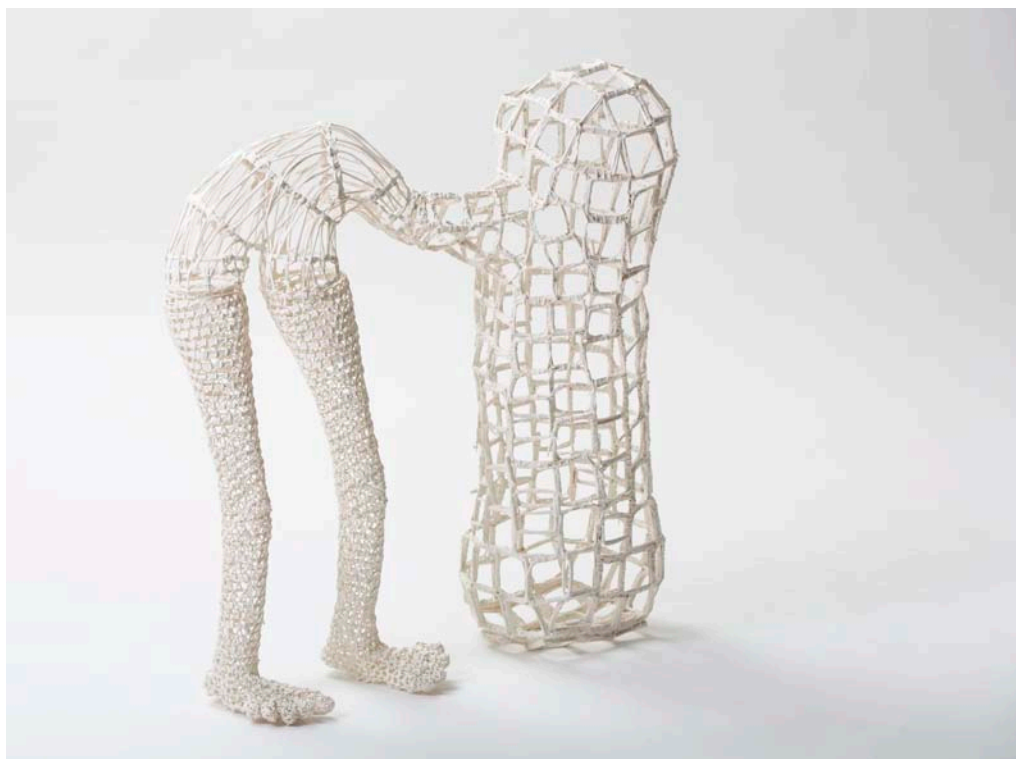
Stéphanie Jacques, Ce qu'il en reste III, 2015, Osier, enduit, fil de lin, 70 x 60 x 23 cm

Première exposition personnelle en France sculpture en vannerie d'osier, gravure, vidéo