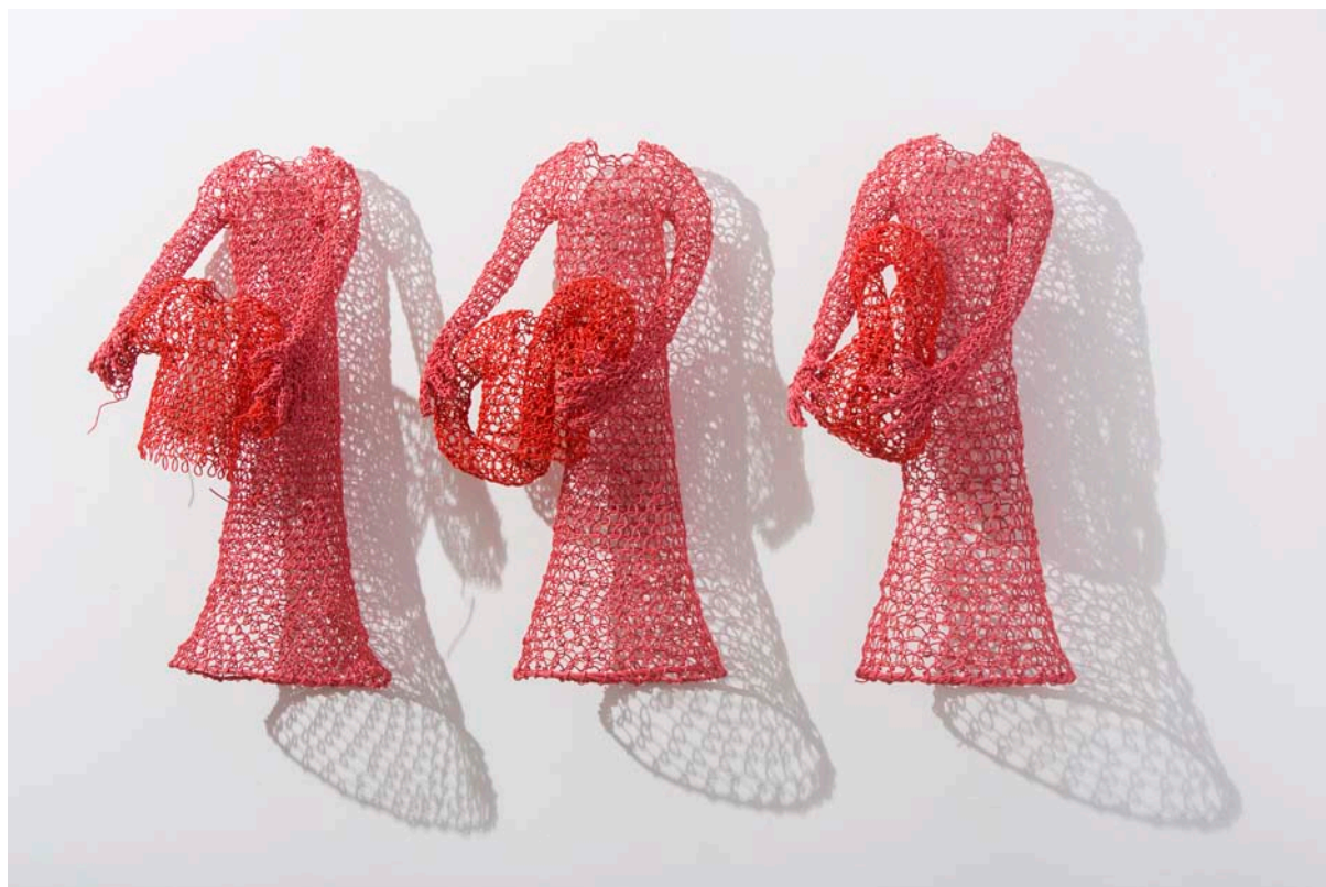
Stéphanie Jacques, Retournement en cours, 2015, H 32 cm x L 16 cm x P 10 cm chacune, câble électrique, photo JP Ruelle

Catalogue de la vente du 22 juin 2008, Maison Osenat, Fontainebleau