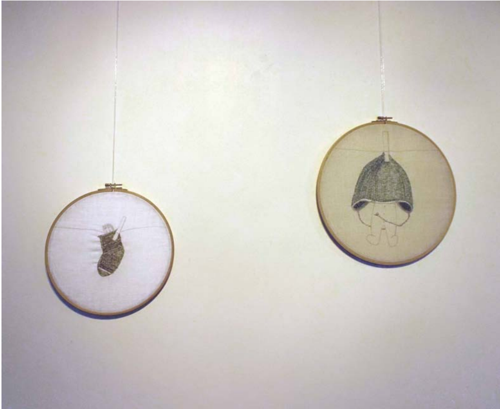
Isabelle Tournoud, Au fil de l'eau, broderie au fil de pêche sur toile de lin, cerceau en bois, 2015 n°1 - Pêche au sandre, diamètre 25 cm / n°2 - Pêche au brochet, diamètre 32 cm Pièces uniques

Isabelle Tournoud a réalisé deux œuvres qui sont le début d'une nouvelle série intitulée Au fil de l'eau. Pièces uniques, inspirées de la broderie traditionnelle, l'artiste en a respecté les codes mais a utilisé comme fil, le fil de pêche qui correspond chacun à un poisson en particulier : marron pour du sandre, vert pour le brochet, les deux se trouvant dans la Loire. Réunissant ses recherches sur la parure de l'enfant ou de la femme, l'artiste y associe le fleuve comme vecteur de vie.