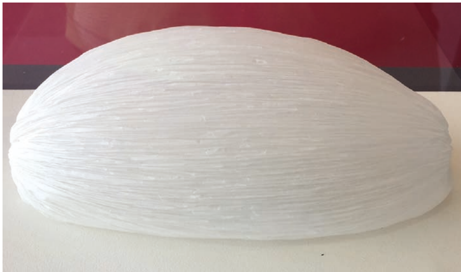
Maryline Pomian, Cocon, papier à cigarette sous plexiglas, 29 x 15 x 13,8 cm, 2013

Maryline Pomian a sélectionné pour l'exposition 4 œuvres : deux reliefs et deux sculptures toutes en papier à cigarette, la seule matière sculptée par l'artiste. Entre Bosquet royal et Rivage, l'artiste nous emmène de manière poétique à flâner le long de cette Loire qu'elle connaît bien et qui lui rappelle des souvenirs d'enfance. Entre le sauvage et la culture royale, le fleuve se métamorphose sans cesse. L'artiste par la grâce de ses sculptures aux couleurs diaphanes à la fois pâles et translucides donc, évoque de manière abstraite mais sensible une nature qu'elle sublime.