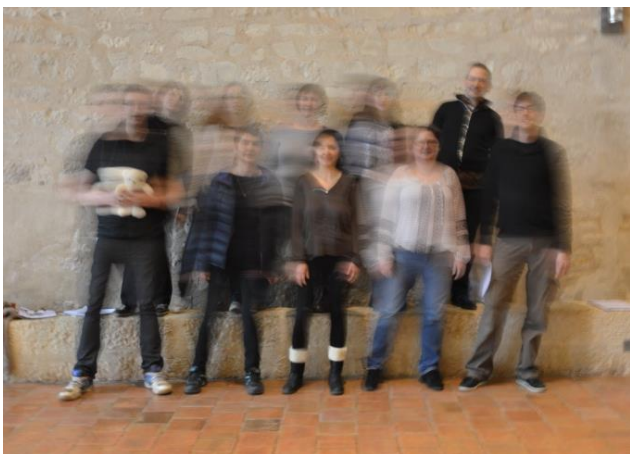
Fantômes, d'après Théâtre pour servantes et oubliés de Fabrice Melquiot / Fabrice Melquiot est représenté par l'Arche, agence théâtrale