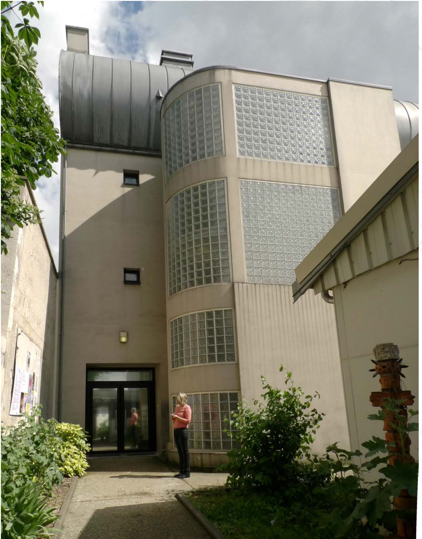
Photographie N°1 : Façade extérieure du Centre d'art (entrée principal côté rue Dombasle) Photographie N°2 : Vue de la cour de la Maison populaire depuis les loges Photographie N°3 : Vue du jardin de la Maison populaire donnant sur le parking rue Danton Photographie N°4 : Vue de la cour de la Maison populaire depuis l'administration Photographie N°5 : Façade extérieure du Centre d'art donnant sur la cour