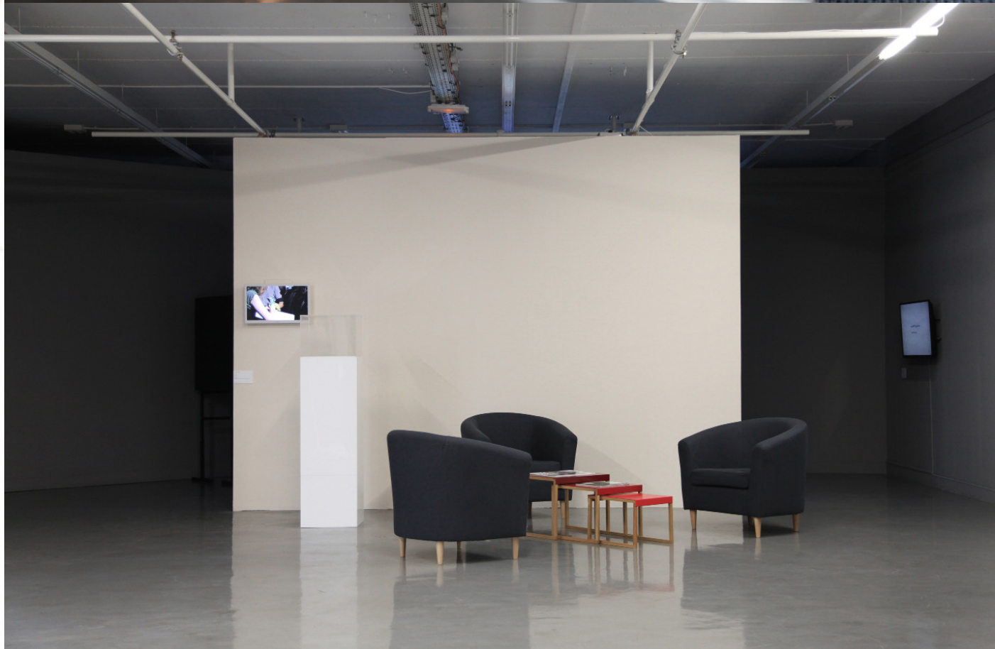
Photographie N°1 : © Aurélie Cenno - Exposition «Véritables préludes flasques (pour un chien) 1/4 : Bruit rose» de Marie Frampier, Maison populaire, 2014