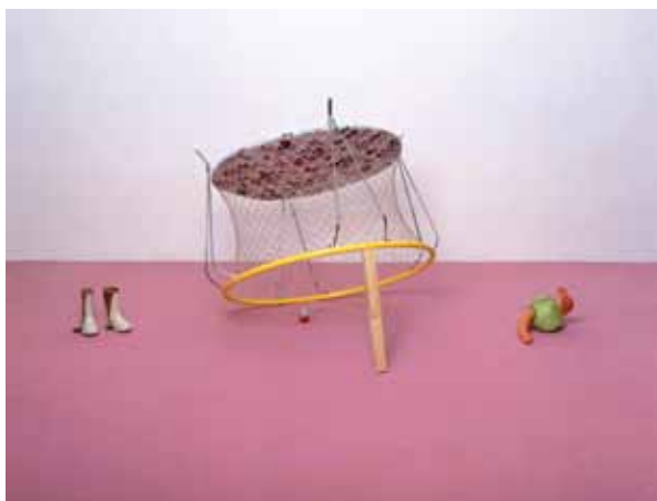
Carsten Höller Komm Kleines, Kriegst was Feines , 1991 Collection Frac Poitou-Charentes