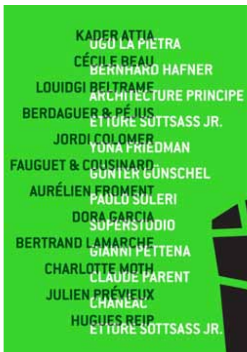
Exposition Double Jeu