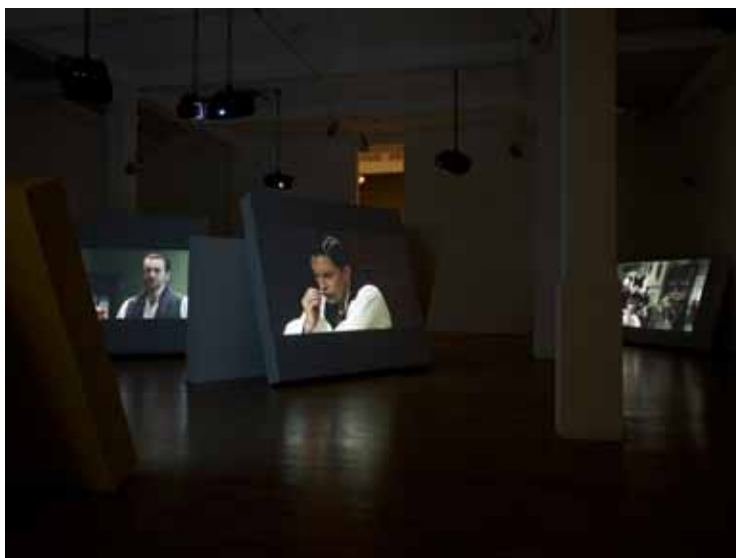
Gerard Byrne A Man and a Woman Make Love, 2012 Vue d'exposition, Whitechapel Gallery, Londres (2013)