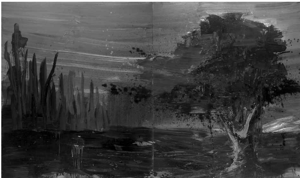
Yan Pei Ming Paysage international, lieu du crime (Lieu de naissance du père de l'artiste) , 1996 Collection Frac des des Pays de la Loire