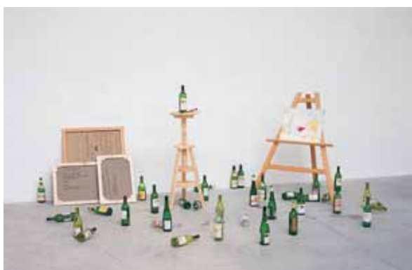
Avdei Ter-Oganian L'atelier de l'artiste en France , 1995 Collection Frac Pays de la Loire