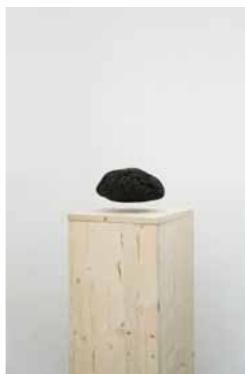
Nils Guadagnin Hanging Stones , 2014 Courtesy l'artiste et la Galerie Derouillon

L'installation de Nils Guadagnin établit un lien visuel et métaphysique fort avec le contexte de la Collégiale Saint-Mexme. Hanging Stones est composée de plusieurs éléments représentant des pierres noires en suspension et en rotation grâce à une force électromagnétique contenue dans tous les éléments constituant l'installation. Depuis la nuit des temps, la suspension et la rotation sont deux forces qui ont longuement été interrogées par l'homme pour comprendre le sens de notre univers. La science s'oppose de manière générale à la religion, qui cette dernière donne une définition biblique et divine à la création de l'univers par le récit de la Génèse.