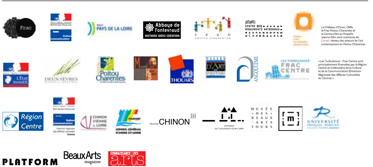
Le Château d'Oiron, CMN, le Frac Poitou-Charentes et le Centre d'Art la Chapelle Jeanne d'Arc sont membres de Carrel, réseau des acteurs de l'art contemporain en Poitou-Charentes.

En partenariat avec : le Frac des Pays de la Loire, le Château d'Angers, l'Abbaye de Fontevraud, le Frac Poitou-Charentes, la Ville de Thouars (Centre d'art la Chapelle Jeanne d'Arc, Galerie des Écuries du Château et Musée Henri Barré), le Château d'Oiron, les Turbulences - Frac Centre, la Ville de Chinon (Chapelle Sainte-Radegonde, Collégiale Saint-Mexme, Galerie contemporaine de l'Hôtel de Ville, Carroi-Musée), le Domaine de Chaumont-sur-Loire, le Musée des Beaux-Arts de Tours.