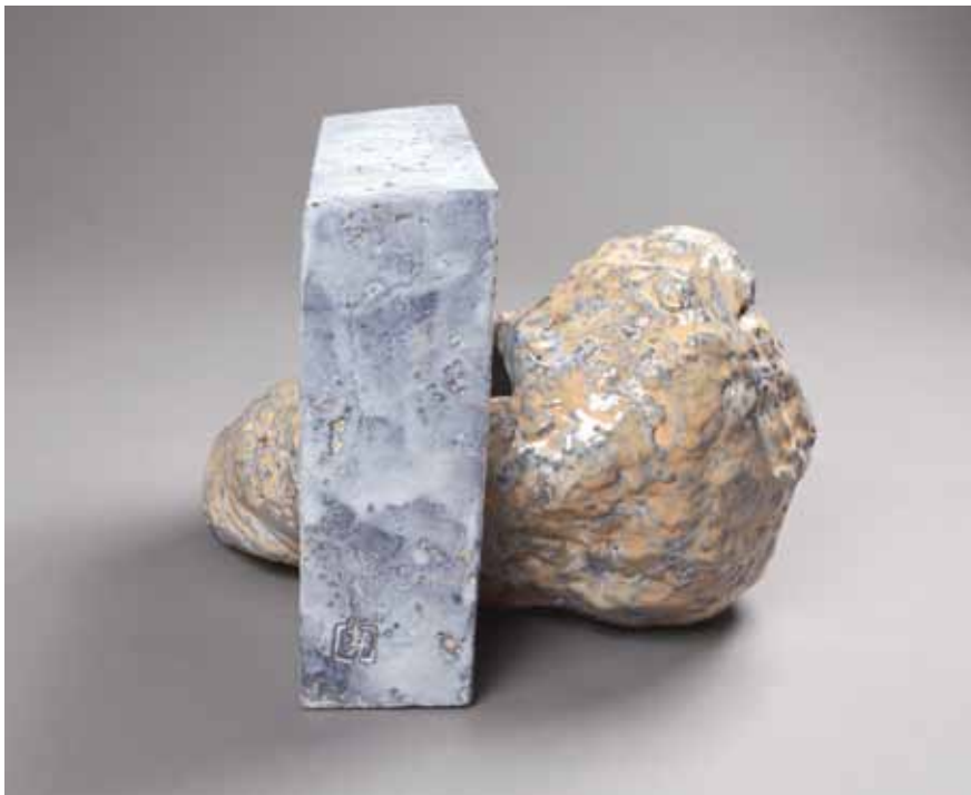
Porte de nuage- 27/30/23 cm