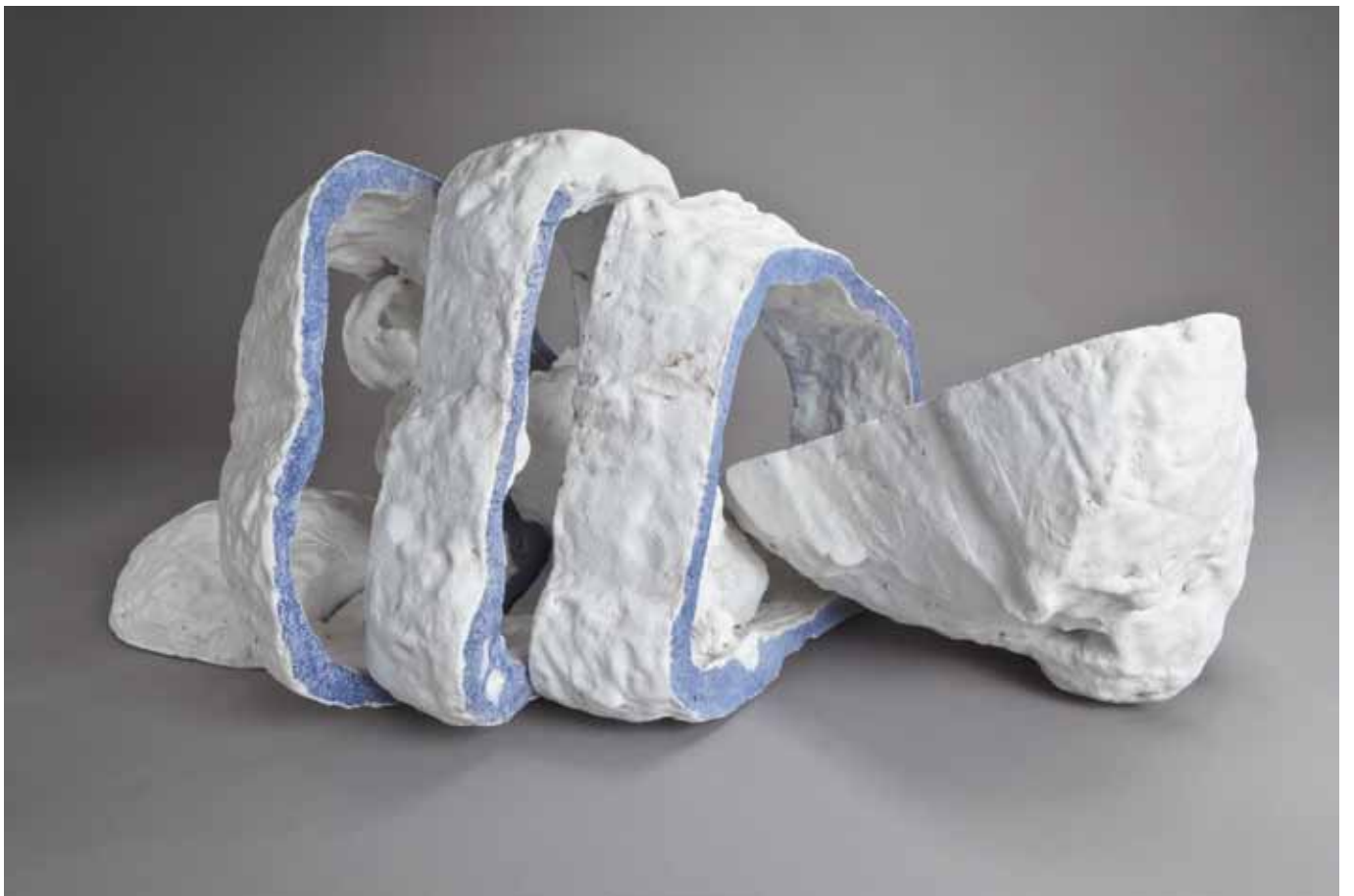
Le cinquième ciel - 31/60/39 cm