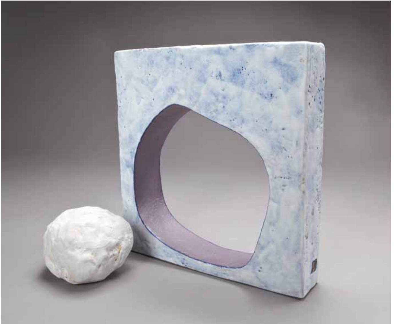
Nuage devant le nuage - 30/6/30 cm