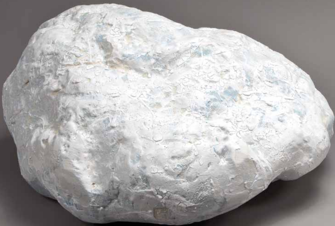
Nuage I - détail en couverture - 30/60/53 cm