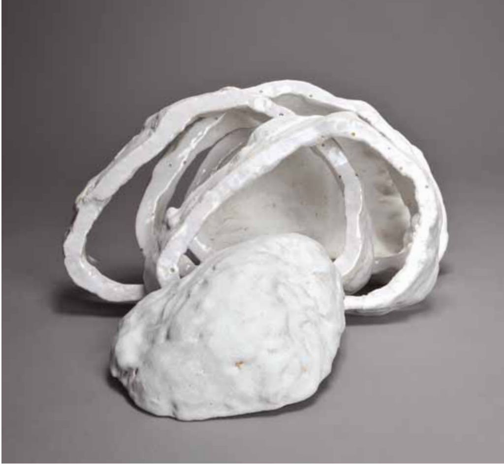
Partage - 23/48/35 cm