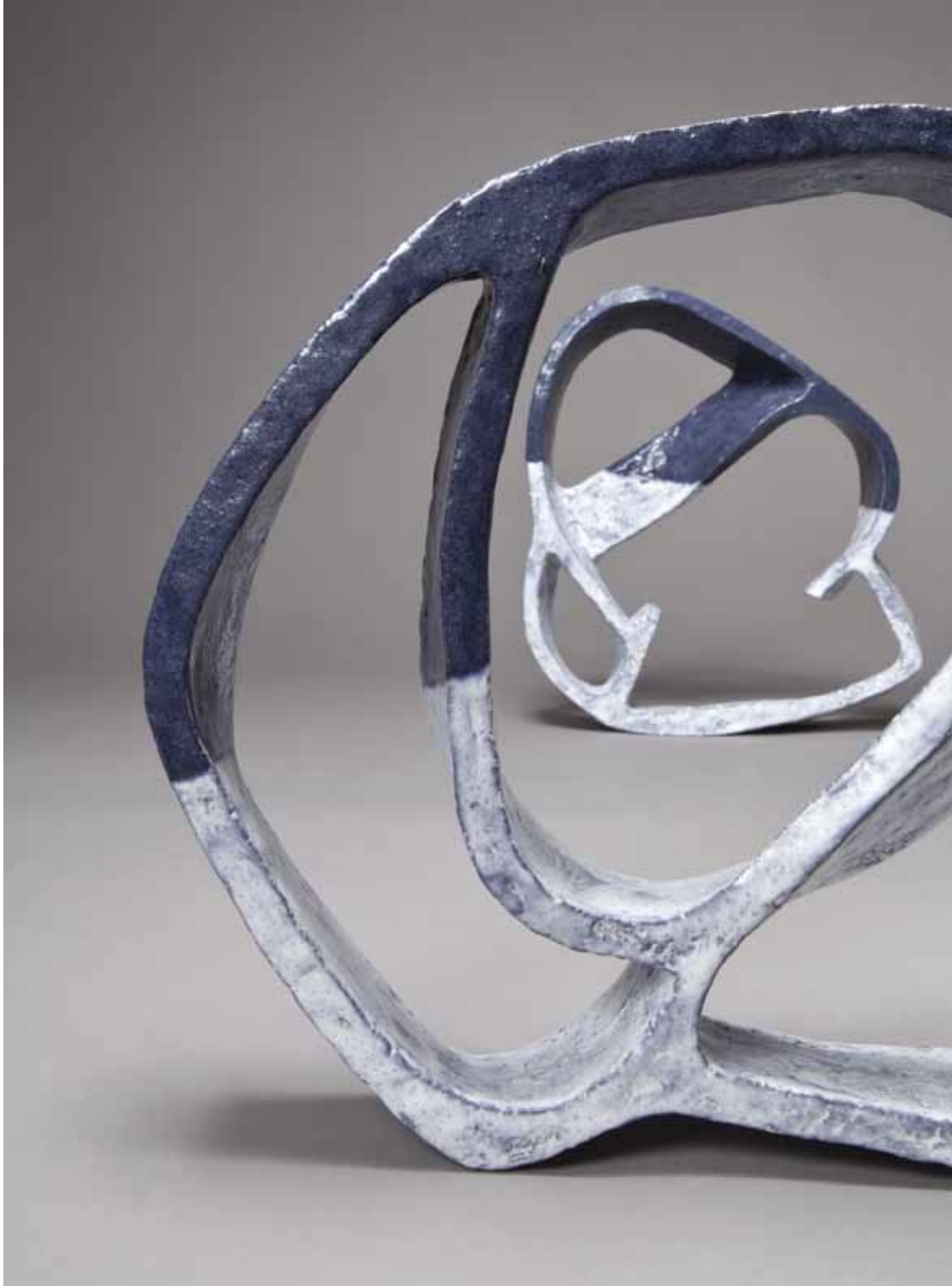
La danse des nuages (MAÏ) I (détail) - 31/40/6 cm La danse des nuages (MAÏ) II - 35/32/6 cm