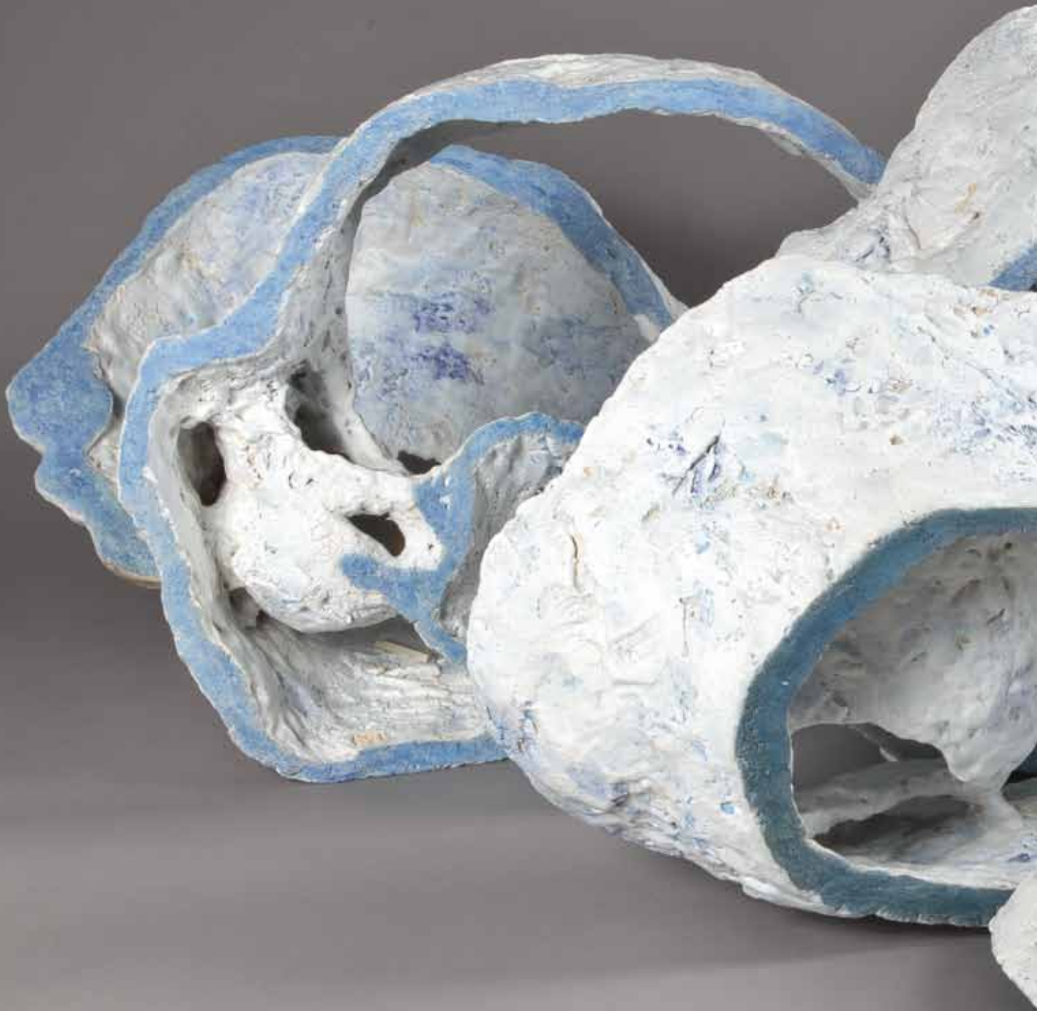
Le bleu souffle le vent - 47/137/77 cm