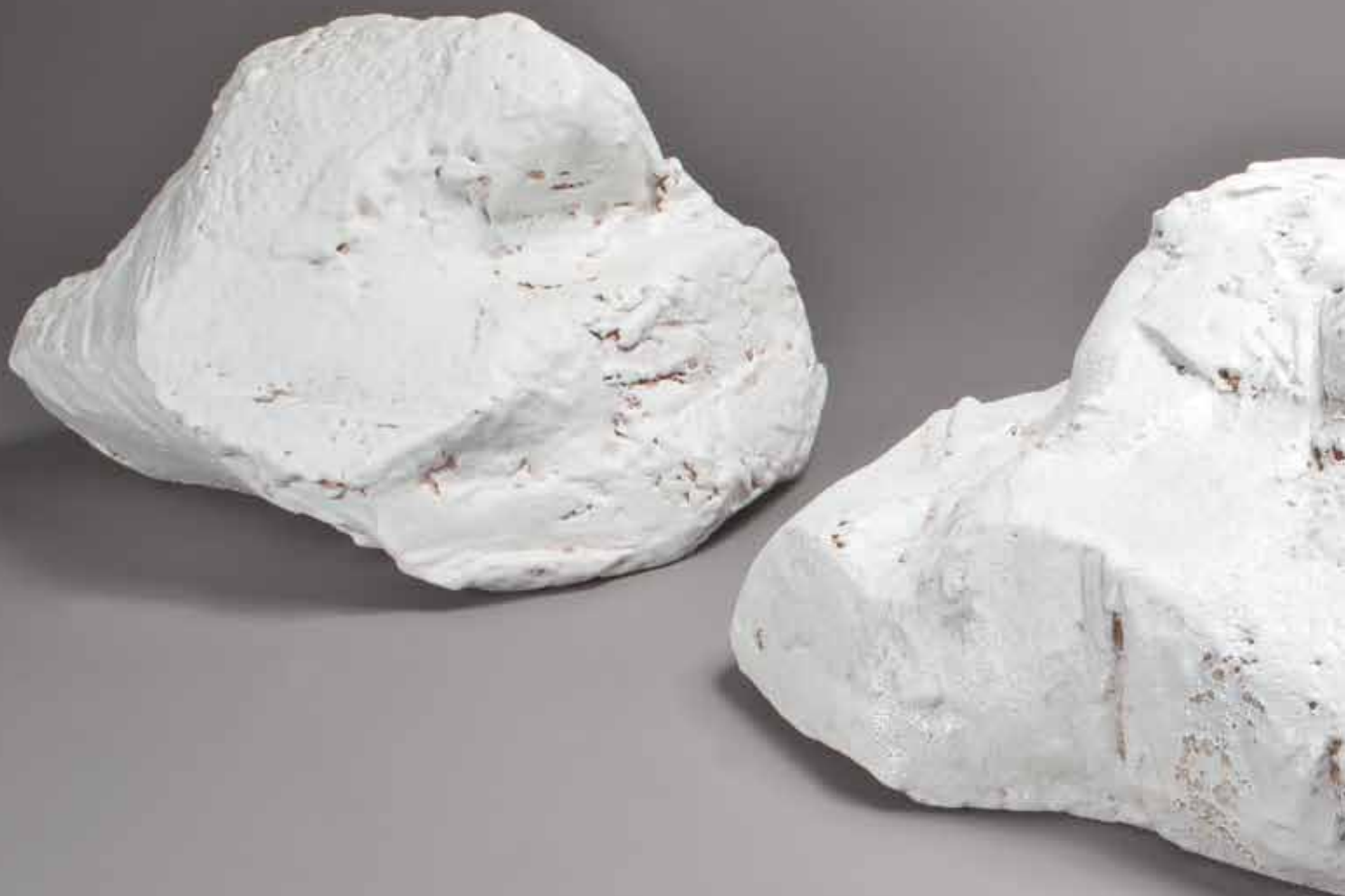
Nuage III - 30/35/30 cm