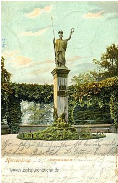
Illustration 1 : Statue Borussia Herrenkrugpark Magdeburg 1866-1946