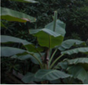
FOTO RÉSIDENCES C R O I S É E