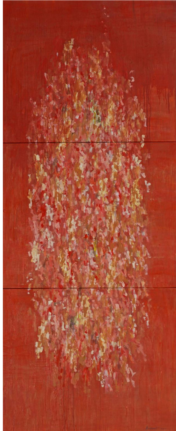
De l'aube à midi 22, 2013.