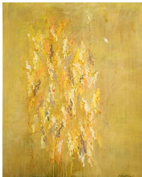
De L'aube à midi 2, 2013.

Son interprétation de poèmes et de musiques, l'amène à collaborer avec de grands artistes dont Khalil Chahine, Claude Nougaro, Aldo Romano ou encore