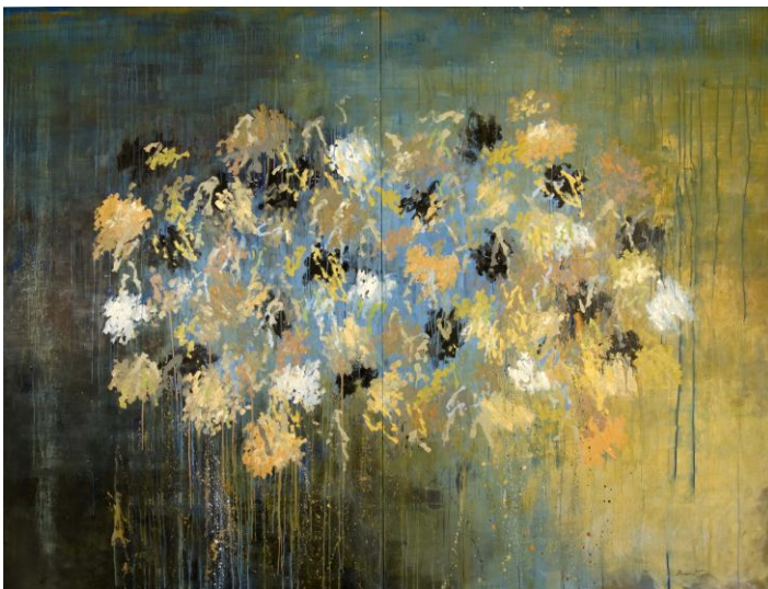
Envolée, 2011. Crédit Jean-Paul Fievet.

Si Jean-Marc Brunet s'inspire des poètes et des écrivains, en retour ceux-ci prennent souvent la plume pour parler de son talent.