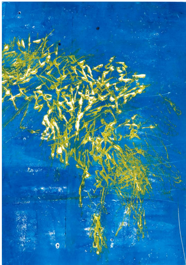
Dans les profondeurs, 2010.