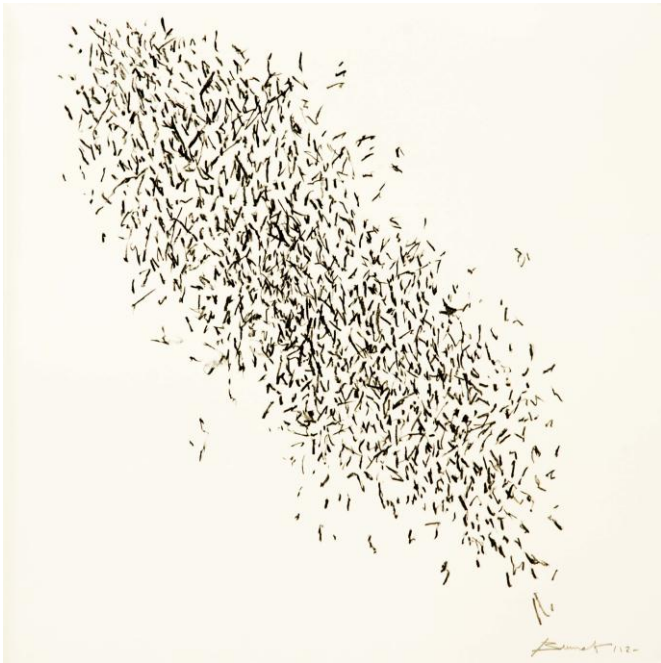
L'oiseau de craie 2 (Hommage à Bernard Noel) Crédit Jean-Paul Fievet