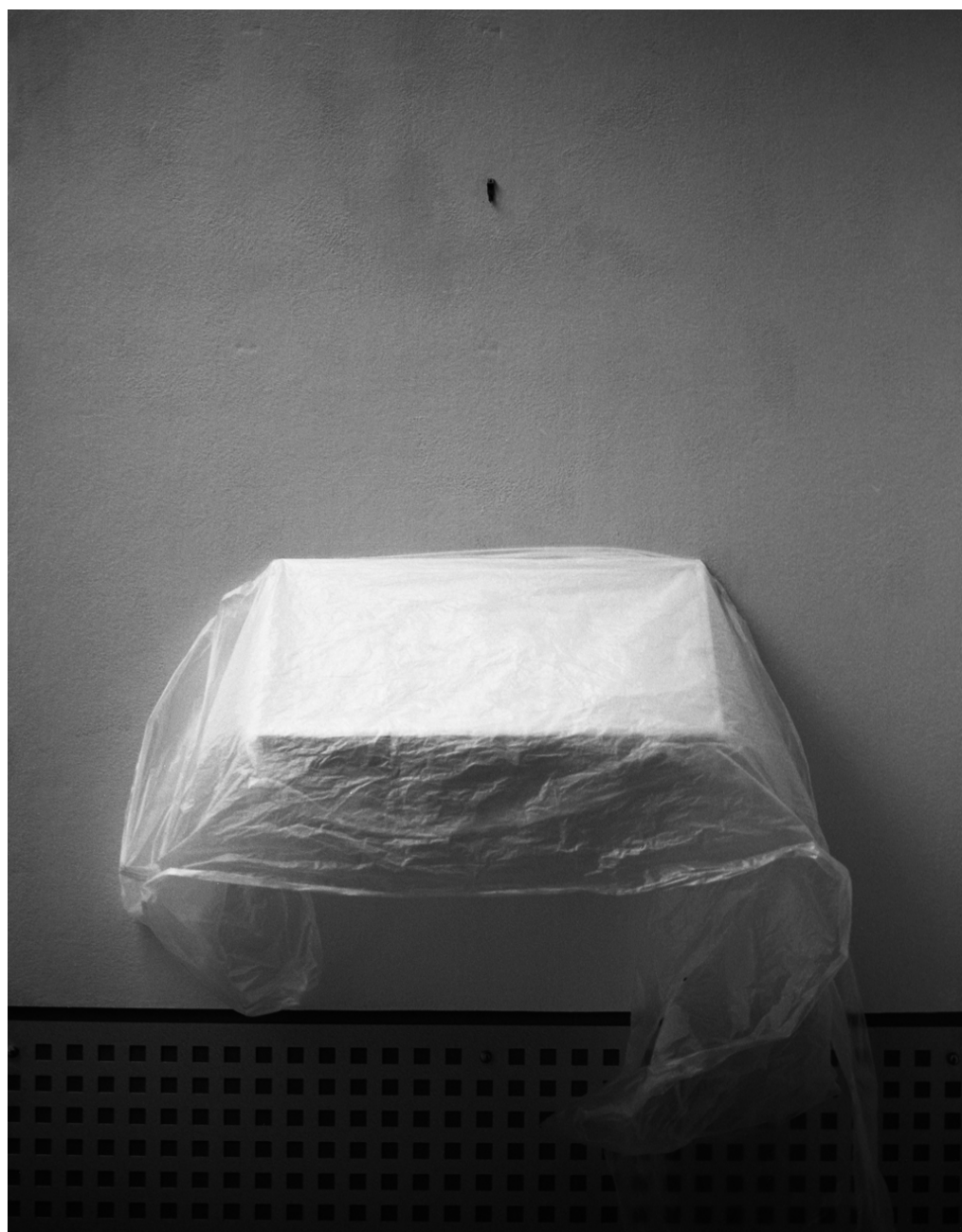
Le nom qui efface la couleur #04, Israel Ariño, 2013

ISRAEL ARIÑO Le nom qui efface la couleur