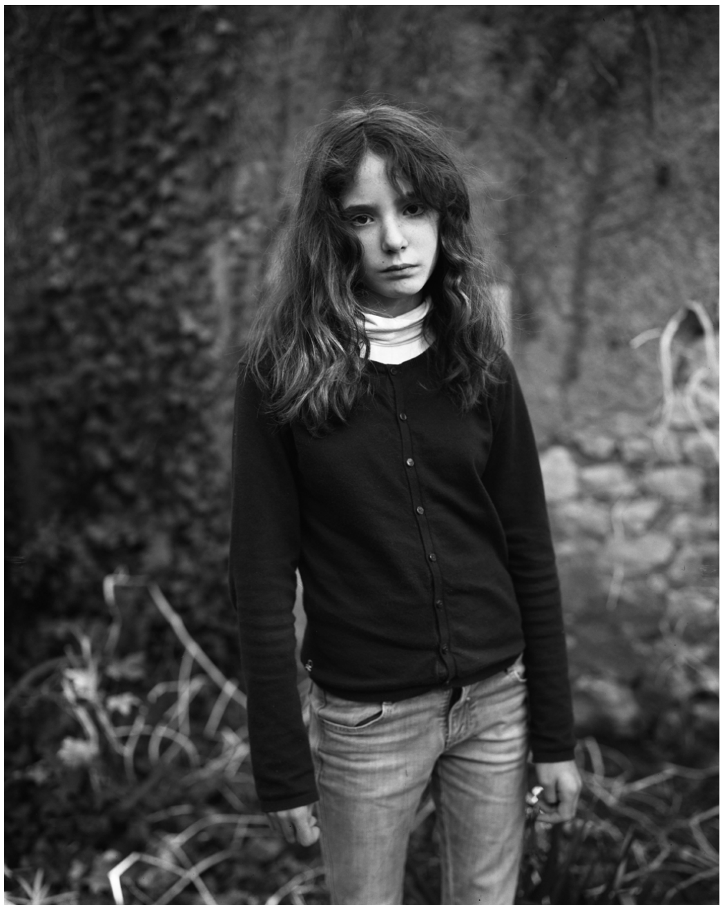
Le nom qui efface la couleur #03, Israel Ariño, 2013

ISRAEL ARIÑO Le nom qui efface la couleur