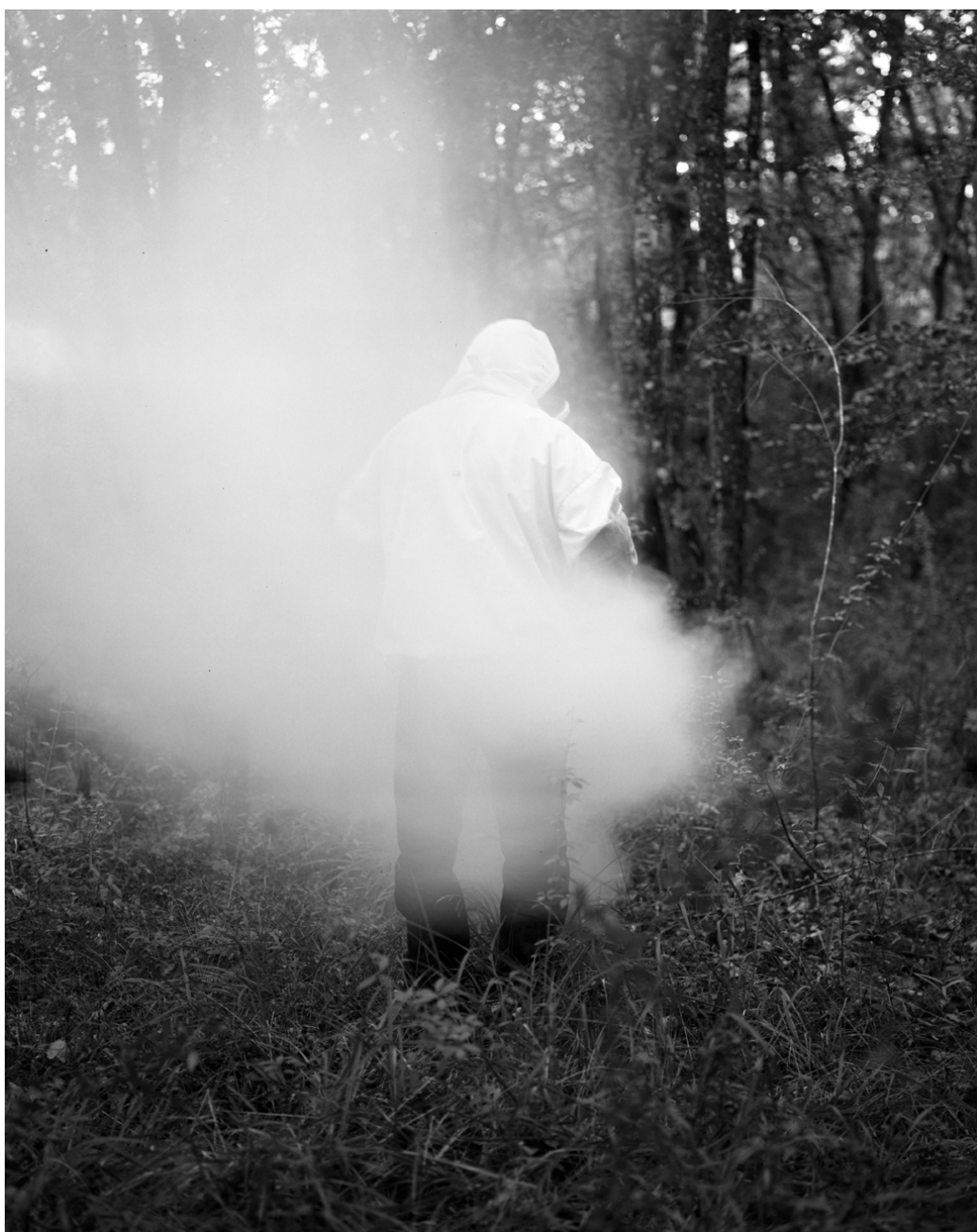
Le nom qui efface la couleur #05, Israel Ariño, 2013

ISRAEL ARIÑO Le nom qui efface la couleur