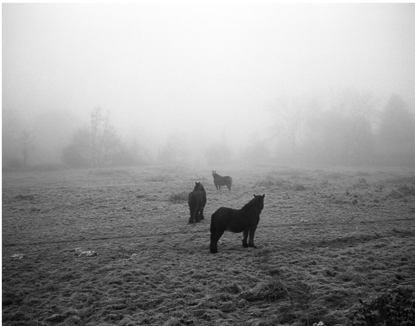
Le nom qui efface la couleur #02, Israel Ariño, 2013