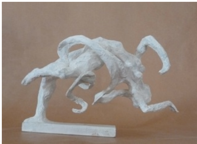
Statuette papier mâché