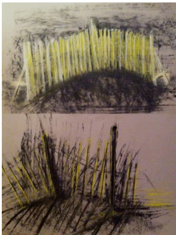
Fusain et craie sur papier 43x61 cm

Mme N présente ici, les premières esquisses et recherches sur ce projet.