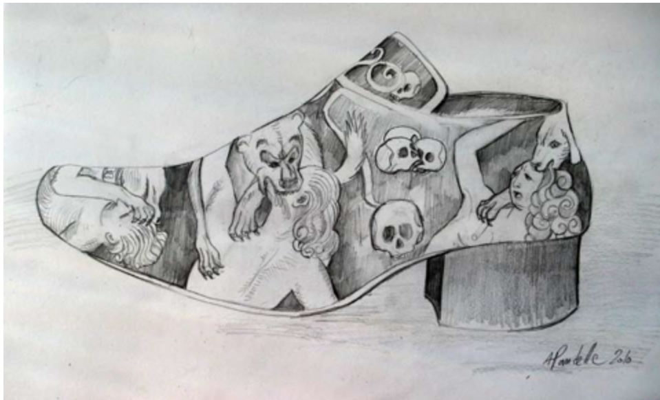
Mine de plomb sur papier 42x29.7 cm

Hôtel Particulier Amelon de Saint Cher, Le Mans