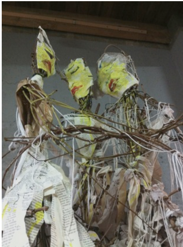
Installation bois, papier, laine 220x70 cm

Amoncellement de souffrances comme celle de la maternité, que les femmes transforment en amour. Amour viscéral. Le corps d'une femme passe de l'être de désir et de séduction, par la danse, la bouche, les formes, les mains à celui de la femme qui enfante. Solides comme du bois, fragile comme le papier. J'aime exposer ce corps, parfois de façon obscène, au regard de tous, pour en montrer la puissance. »