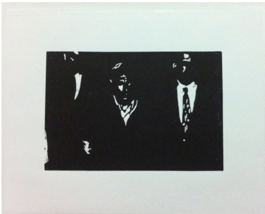
Linogravure 23x18 cm

« Photos souvenirs, archétypes, impressions de déjà-vu, inconscient collectif font depuis longtemps partie de mon univers. Je suis sans cesse à la recherche de nouveaux supports (photographie, plastique, tissu) ; j'ai longtemps travaillé par séries ; photographies de familles conservées dans des bocaux, La transparence et l'idée de la trame sont depuis longtemps récurrentes dans mon travail. »