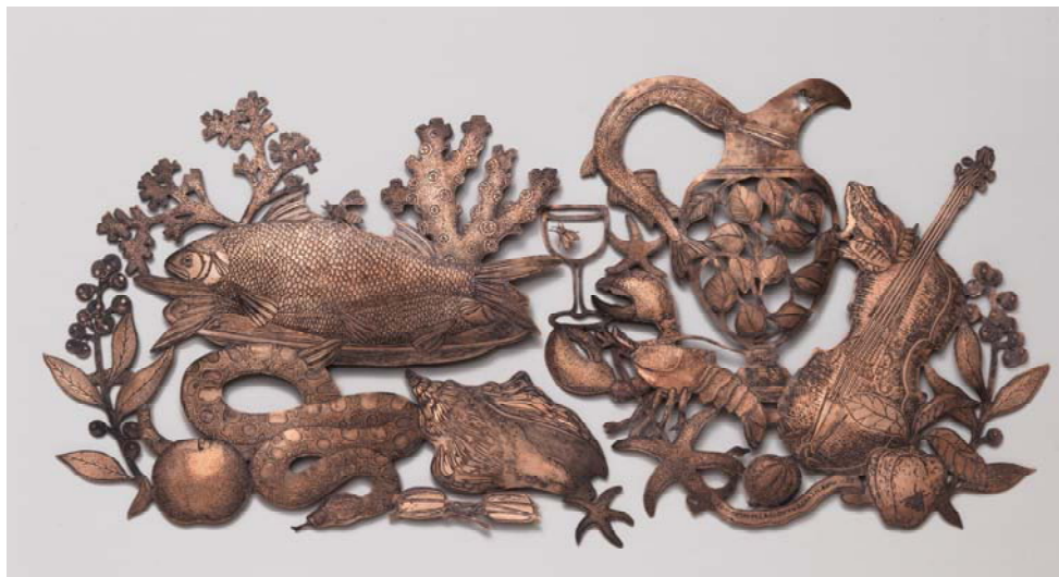
Michaël Cailloux, Lyrisme, plaque de gravure pour l'eau-forte en cuivre découpé et gravé, martelage au dos, vernis Pièce unique. Encadrement sous rhodoïd, 42,5 x 64 cm

Exposition du 12 OCTOBRE au 8 DECEMBRE 2013