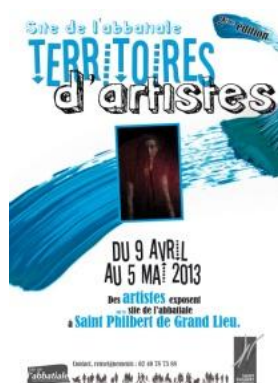
Affiche de l'exposition 2013