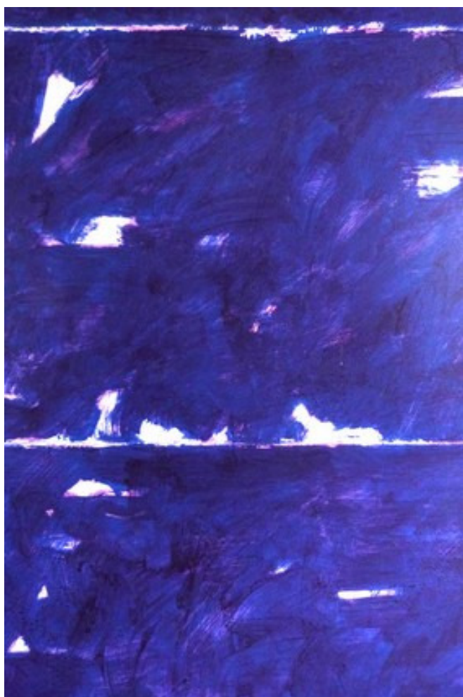
daniel bambagioni, Notte smarrita , détail, 2012 © nc