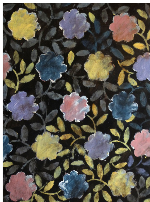
daniel bambagioni, Ostinato, détail