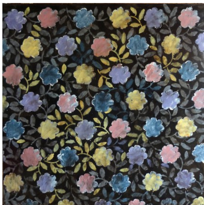
daniel bambagioni, Ostinato

Ce principe étant à rapprocher de sa conception des "ADIACENTI" (adjacents), qui sont composés de deux peintures de même format disposées côte à côte, formant ainsi deux espaces différents contigus, comme les deux faces d'une même médaille. Principe qu'il poursuit depuis 1993. La partie gauche se présente comme une variation sur une couleur. La partie droite "Ostinato" qui renforce ou s'oppose à la première est un motif répétitif, ayant souvent la forme d'une fleur.