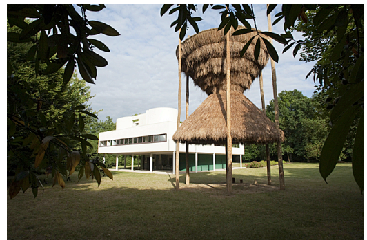
Santiago Borja, Sitio, Villa Savoye, Poissy, du 12 juin au 25 septembre 2011