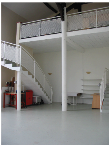
Vue de l'atelier