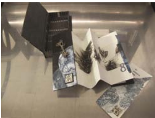
Jardin des paroles, livre de Joëlle Dumont