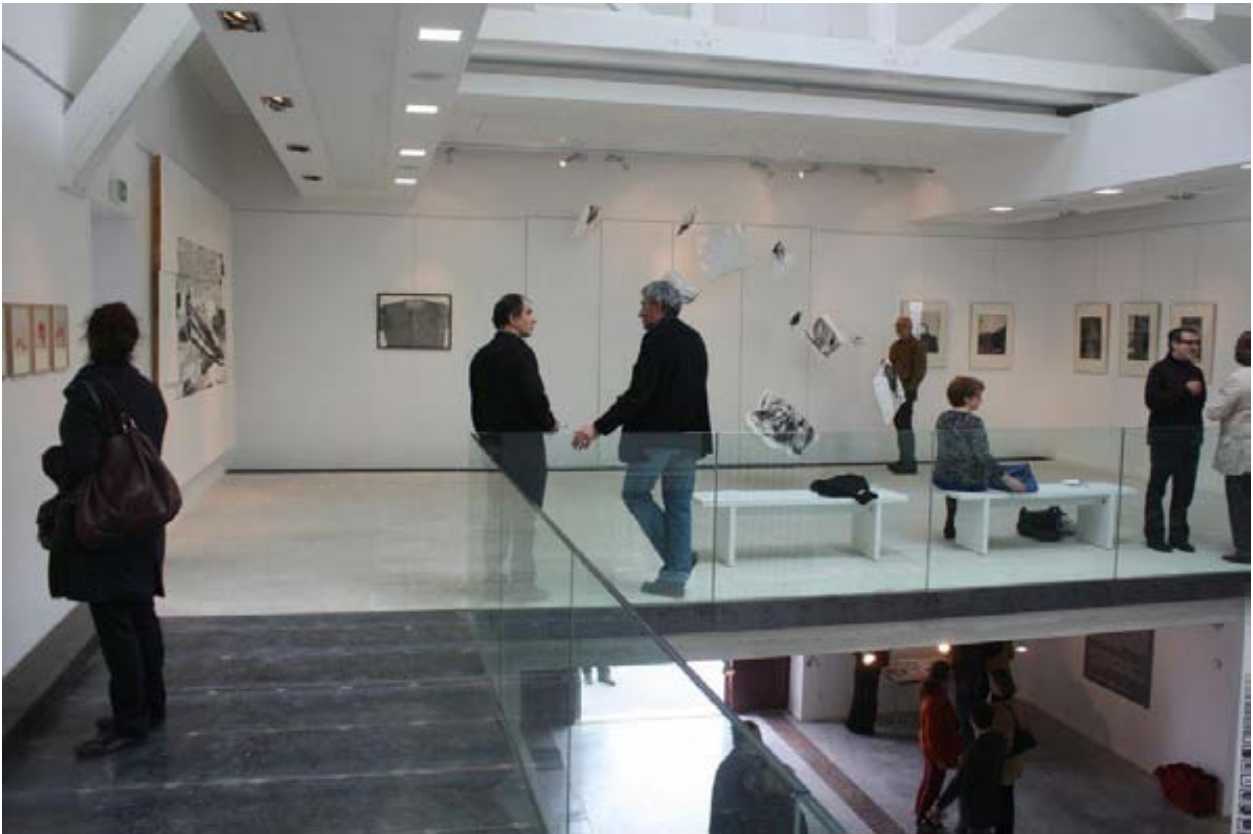
Vue d'ensemble de l'espace « Les choses »