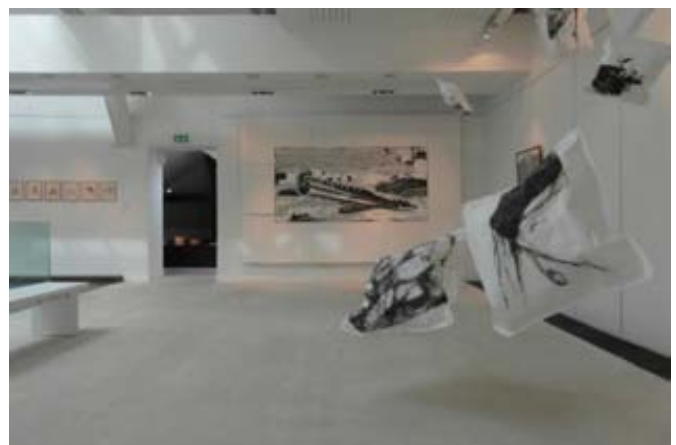
Vues de la mezzanine, espace Les Choses