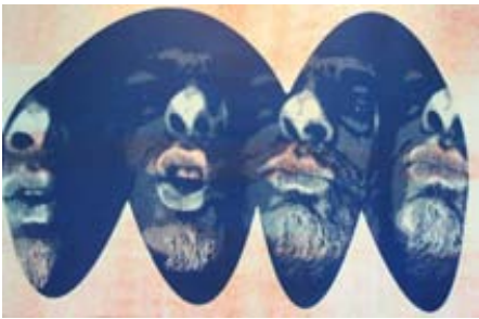
P. Hémary , détail