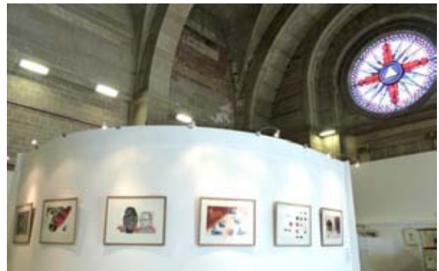
Vue de Estampe dans la ville #3

> Voir le catalogue de Coïncidence des contraires sur le site de Graver Maintenant : http://spip.gravermaintenant.com/IMG/pdf/Coincidence_des_contraires_catalogue.pdf