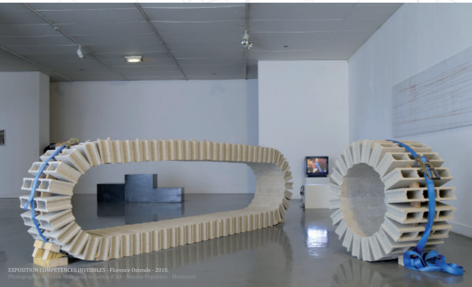
EXPOSITION COMPÉTENCES INVISIBLES - Florence Ostende - 2010.

Construit au 9 bis rue Dombasle, le Centre d'art de la Maison Populaire est un espace de 160m 2 (8m x 19m) situé en plein cœur de la ville de Montreuil.