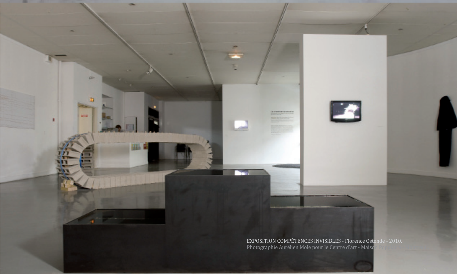
EXPOSITION COMPÉTENCES INVISIBLES - Florence Ostende - 2010.