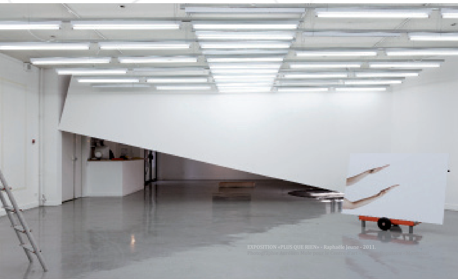
EXPOSITION «PLUS QUE RIEN» - Raphaële Jeune - 2011.