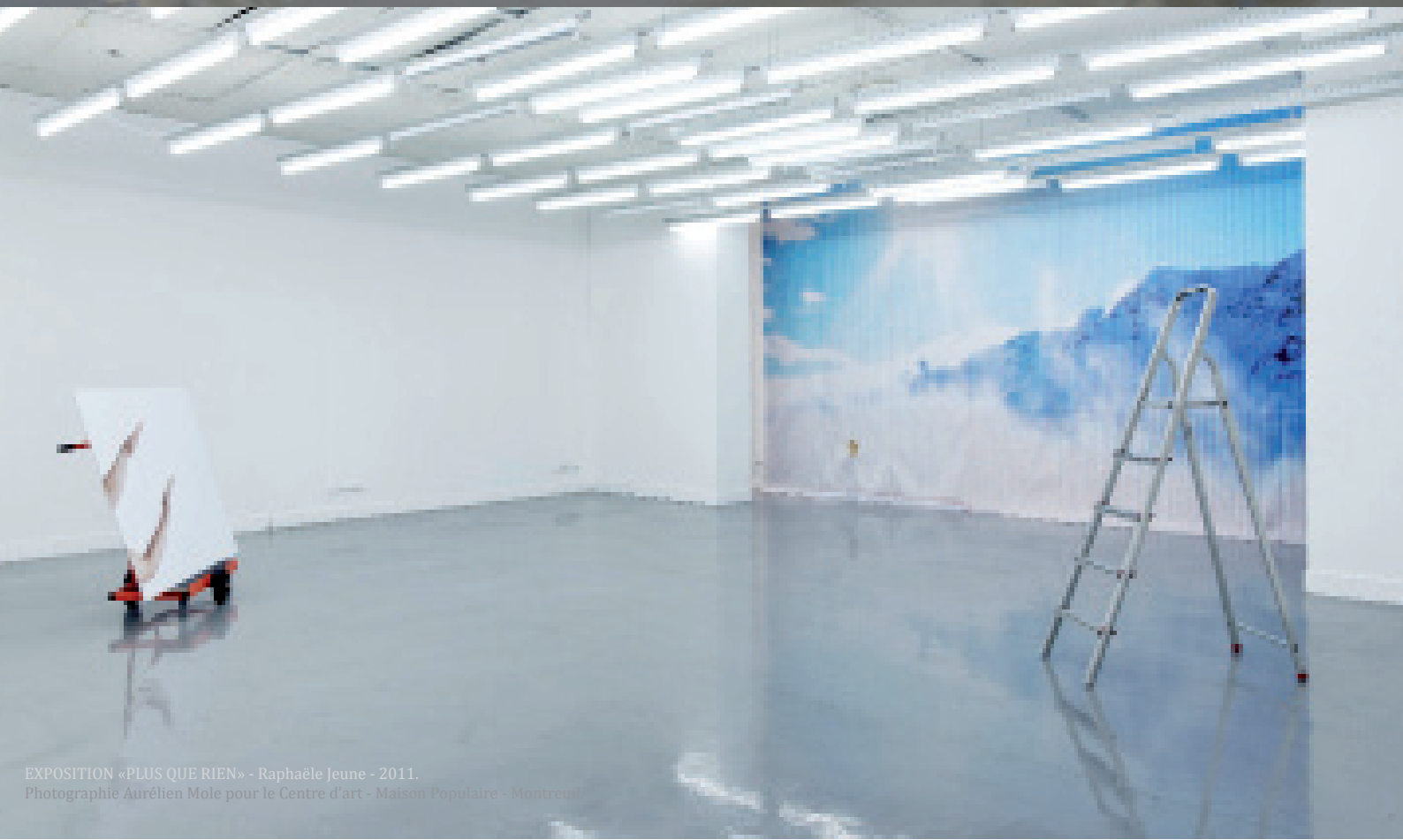
EXPOSITION «PLUS QUE RIEN» - Raphaële Jeune - 2011.