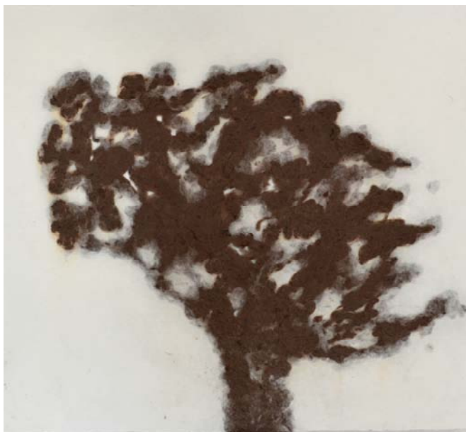
Jean-Michel Letellier, "Arbre", 2012, pièce unique, fibre de mûrier à papier et pigments 90 x 80 cm

L'art gestuel à une place primordiale puisque c'est par le geste que l'artiste va créer ses motifs.