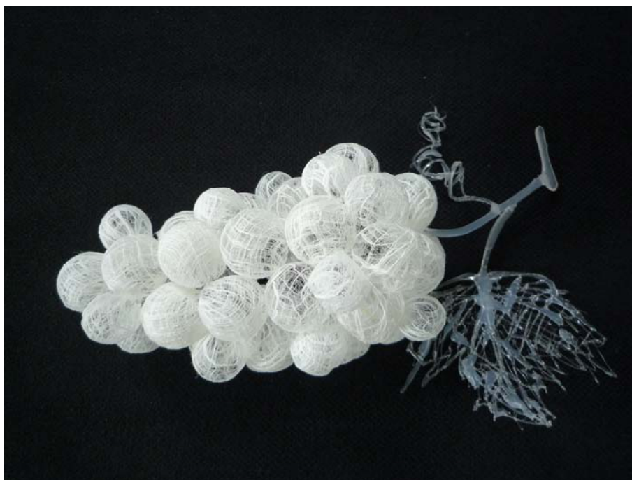
Miki Nakamura, "Budo-u", grappe , 2013, n°1/8, fibre de mûrier à papier, 15 x 29 x ht 14 cm (mesures de la boîte plexi)