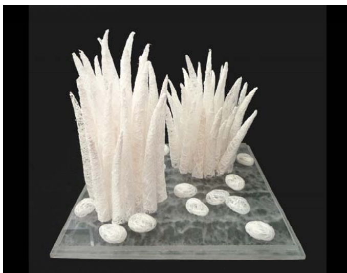
Miki Nakamura, "Les doigts de Bouddha", 2013, n°1/8, fibre de mûrier à papier, 30 x 30 x ht 30 cm (mesures de la boîte plexi)