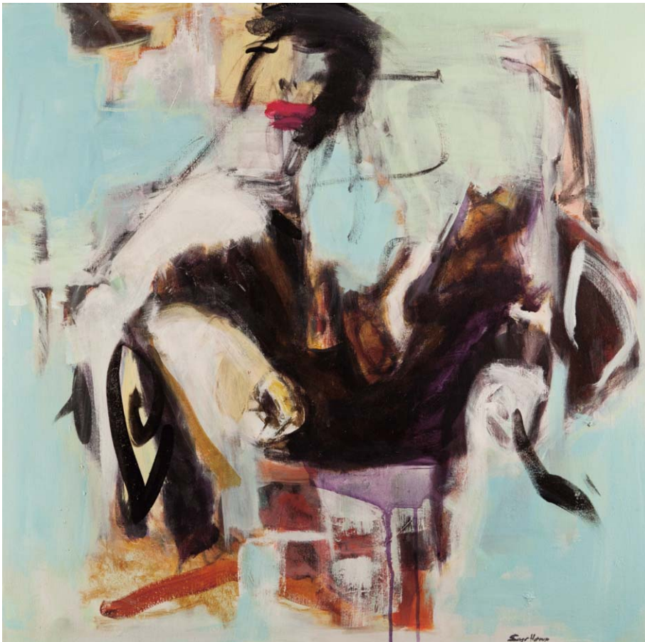
Model in a patterned landscape 80 x 80 cm Acrylique sur toile