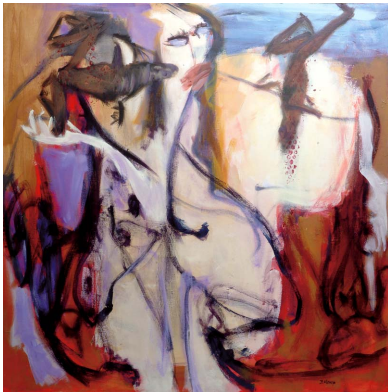
Woman with two frogs 80 x 80 cm Acrylique sur toile