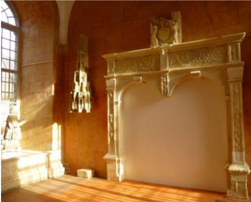
Vue de la salle lapidaire