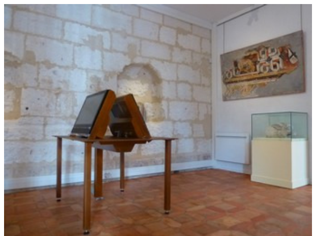
Ecrans tactiles pour consultation individuelle