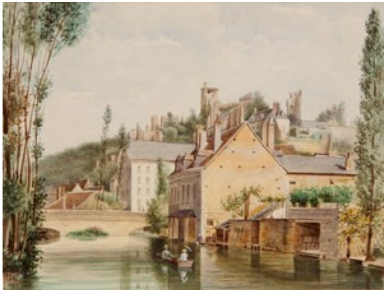
Gervais Launay, Vue prise des moulins de la rue de la Grève , 1850