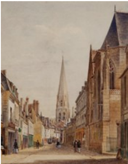
Gervais Launay, La rue du Change en 1856 © Aurore et Léna

Une base iconographique rassemble les documents conservés dans les collections patrimoniales. Ces documents précieux non exposés en permanence peuvent être examinés, agrandis, comparés par le visiteur. Deux reconstitutions en 3D permettent d'apprécier l'église Saint-Martin aujourd'hui détruite et l'abbaye de la Trinité à différentes périodes. Des jeux complètent le dispositif multimédia.