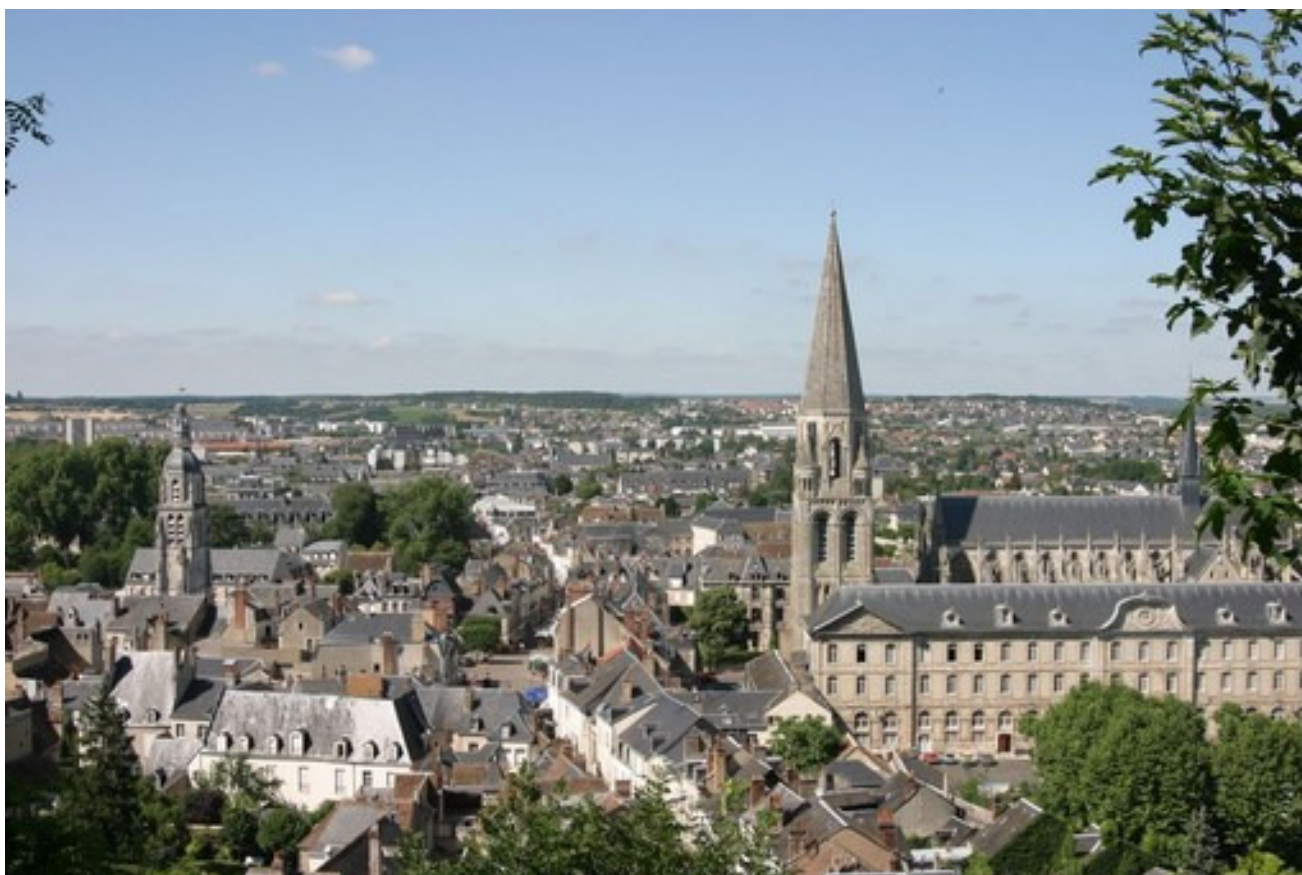
Vendôme, Centre ville

Accessible aux touristes et aux Vendômois, le CIAP propose une découverte ludique, instructive et interactive de l'urbanisme et du patrimoine de Vendôme.