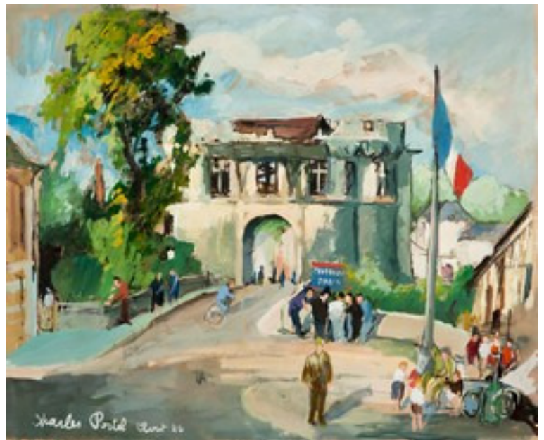
Charles Portel, La porte Saint-Georges , 1944

La première salle est dédiée à des expositions-dossier régulièrement renouvelées. Pour l'ouverture du CIAP, nous proposons une découverte du quartier ancien reconstruit après la guerre de 1940.