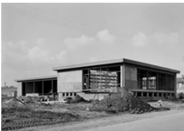
Centre culturel en chantier en 1965 au sein du quartier des Rottes