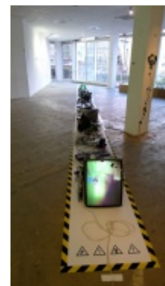
"Analog-HD" de Gijs Gieskes