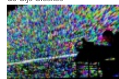
"Pure Data read as pure data" de Nicolas Maigret