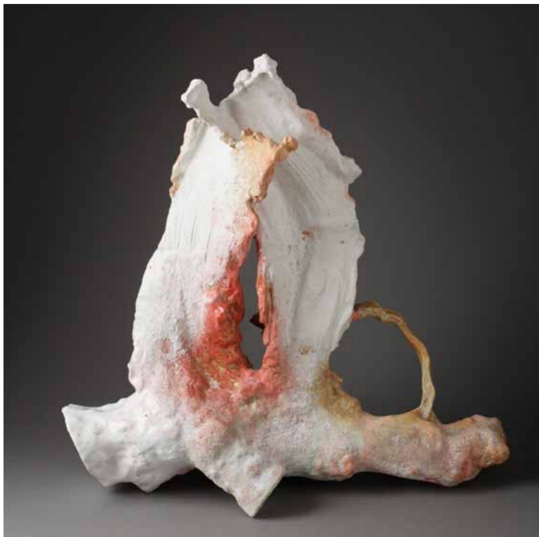
8 Territoire intérieur - 2011 57 x 24,5 x 56 cm