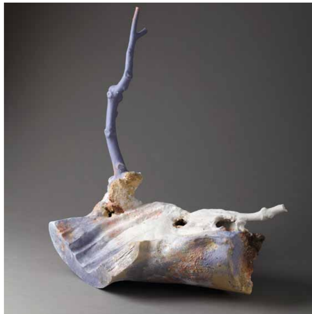
9 Barcologie - 2011 55 x 39,5 x 58,5 cm