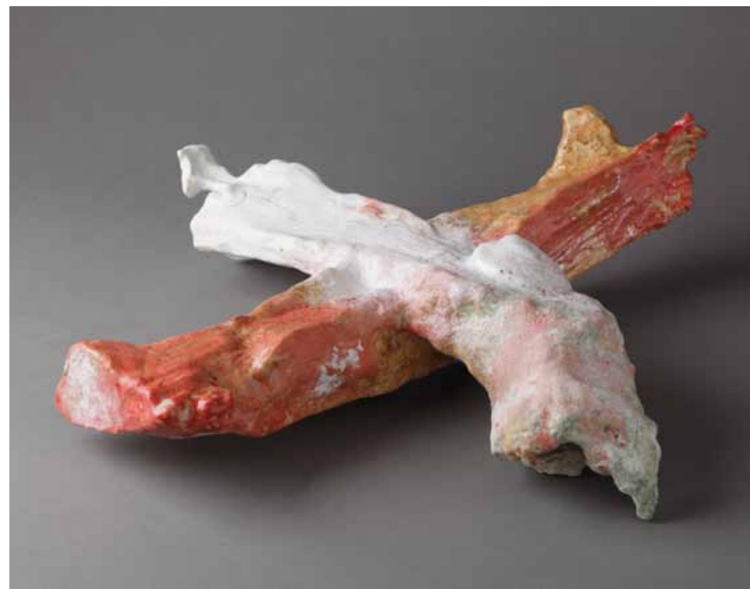
13 | Crucile - 2011 53 x 53 x 12 cm