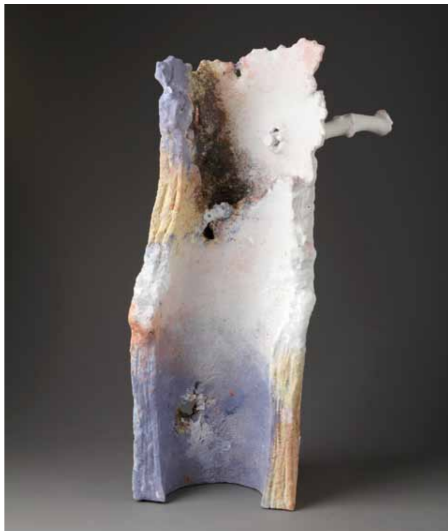
6 | Tégule - 2011 31,5 x 19,5 x 52,5 cm