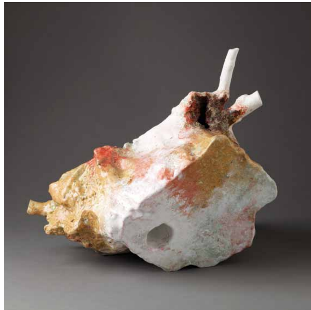
11 | Tronquine - 2011 42,5 x 29 x 38 cm