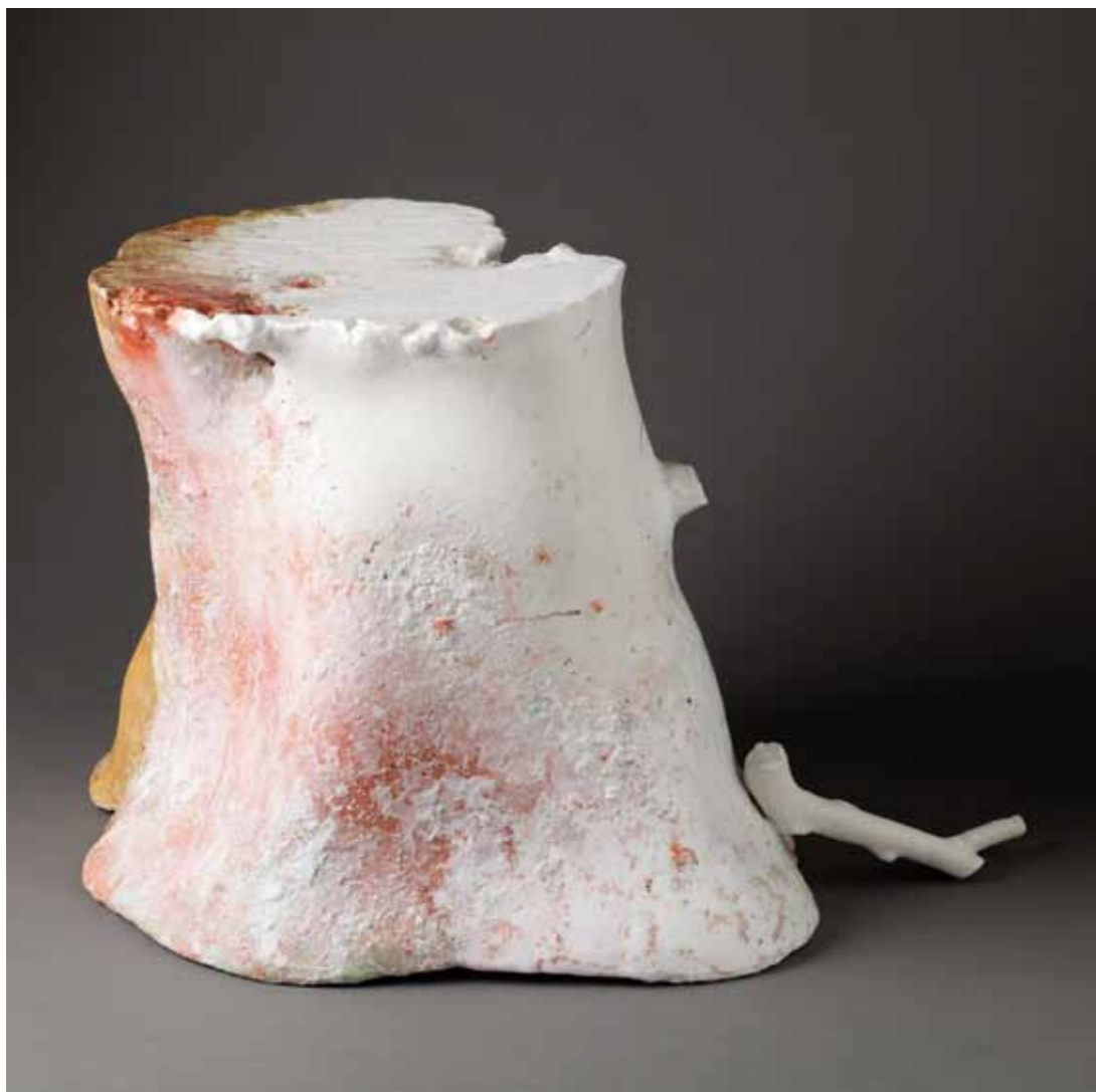
10 | Tronquine - 2011 51 x 38 x 31,5 cm