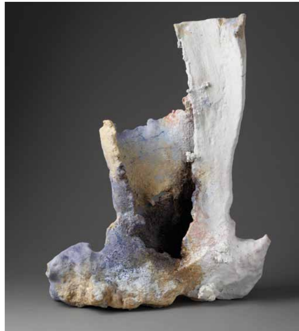
7 | Territoire intérieur - 2011 45 x 20 x 57 cm