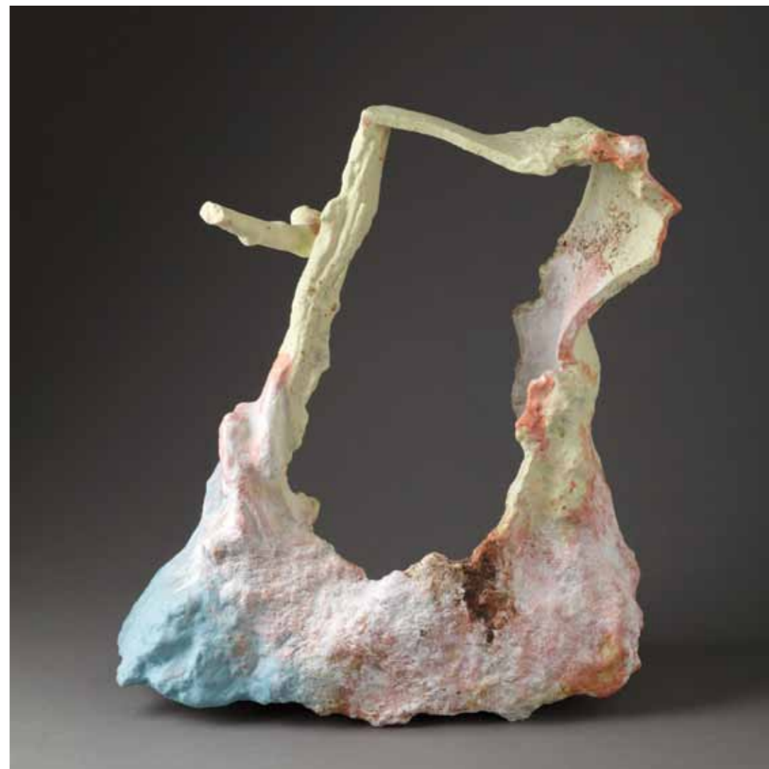
5 | Opertine - 2011 41 x 15 x 44,5 cm