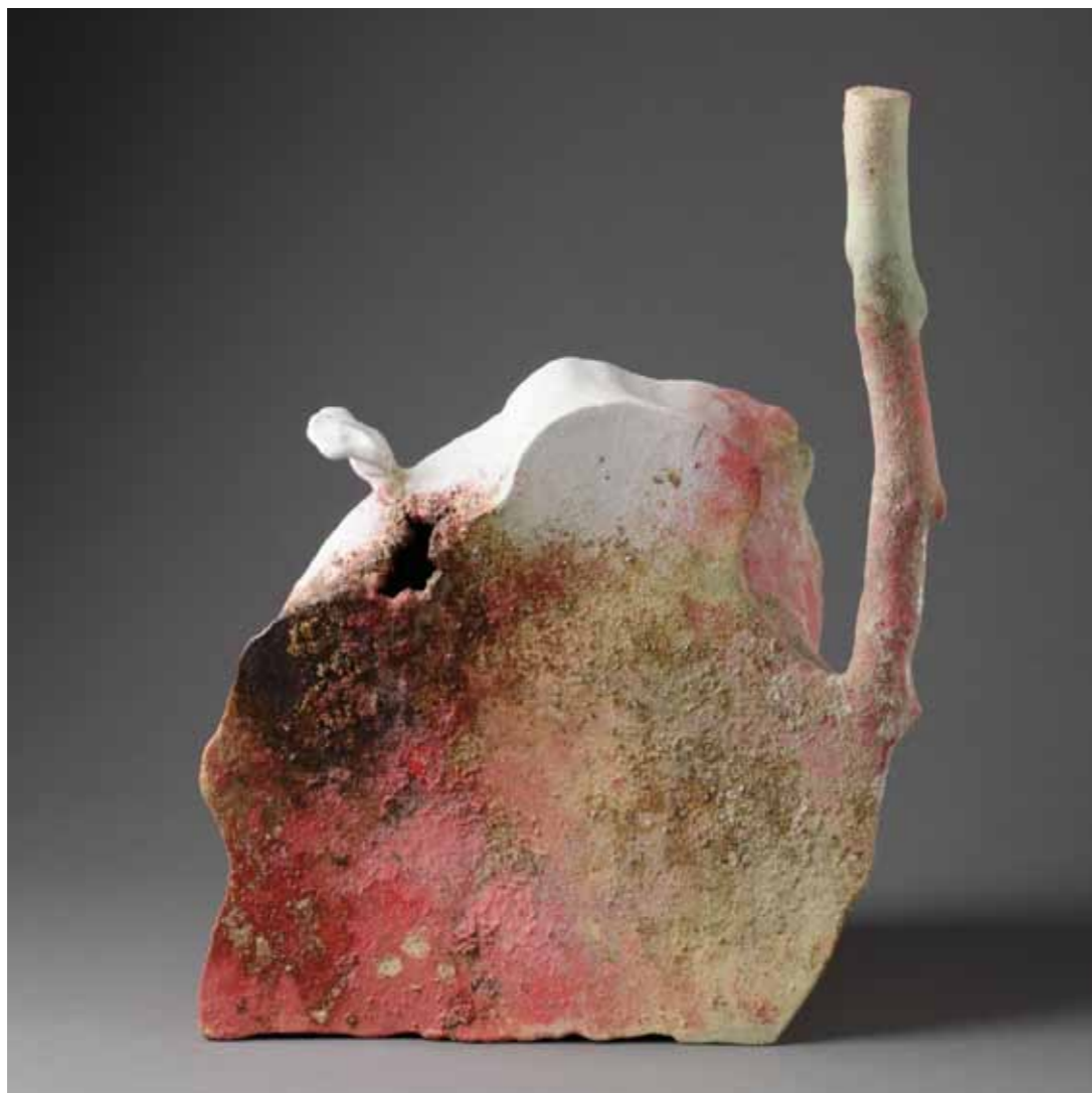
4 | Arbologie - 2010 38 x 24 x 48 cm