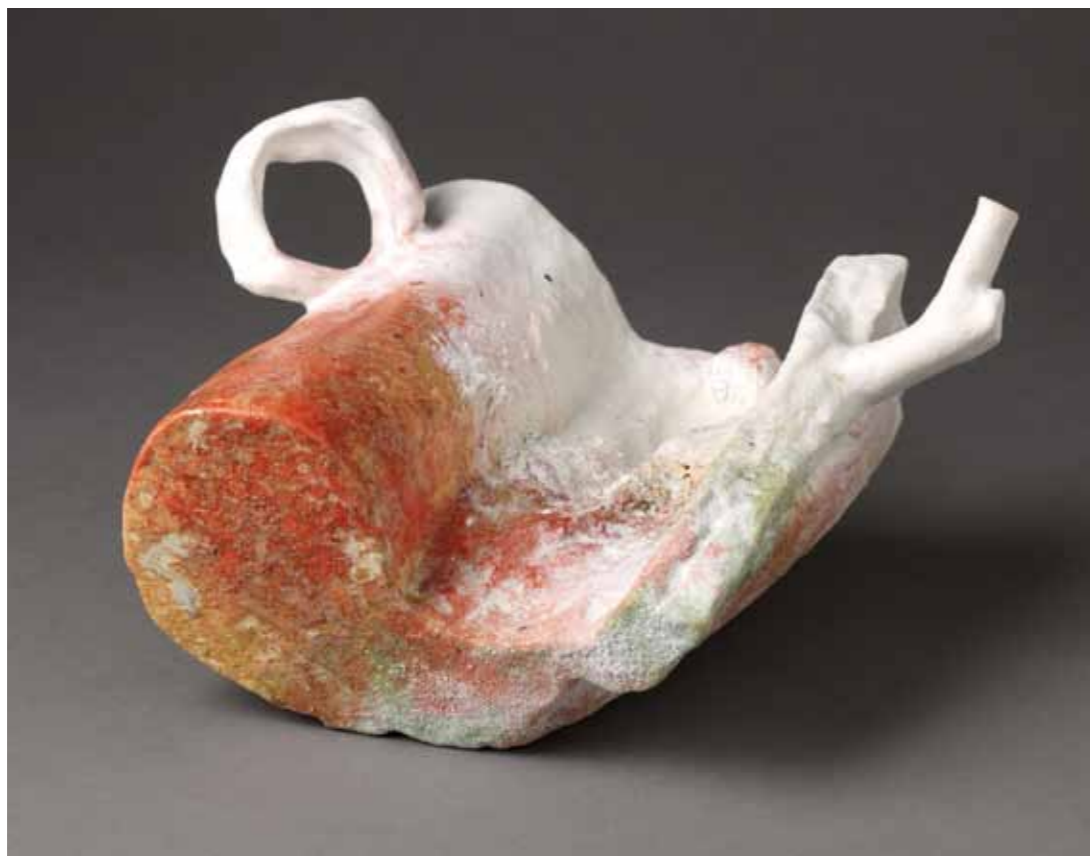
12 | Tédule - 2011 22,5 x 19 x 13,5 cm