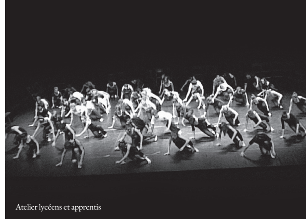
Atelier lycéens et apprentis