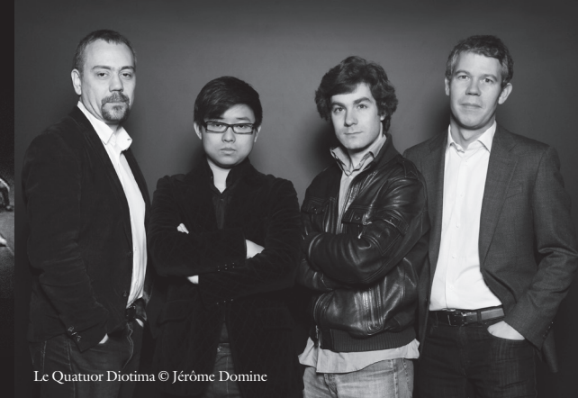
Le Quatuor Diotima © Jérôme Domine