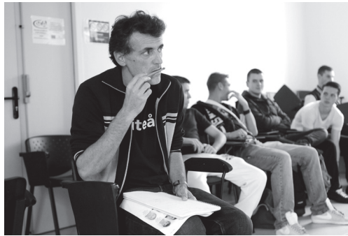
Atelier avec Stéphane Imbert