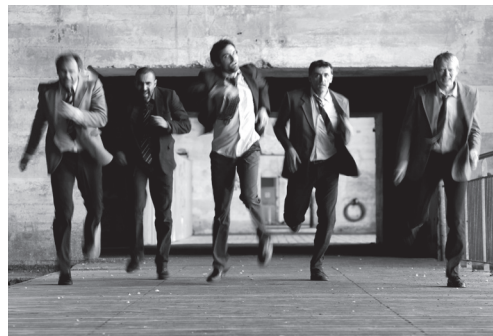
Wonderful World © Wilfried Thierry

Établissement concerné par le projet Collège Gaston Couté de Meung sur Loire (option théâtre, classe de 5 e )