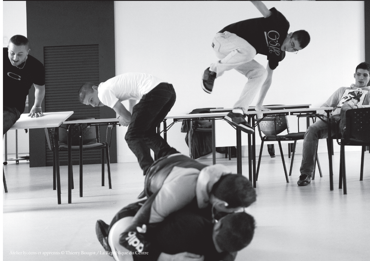
Atelier lycéens et apprentis